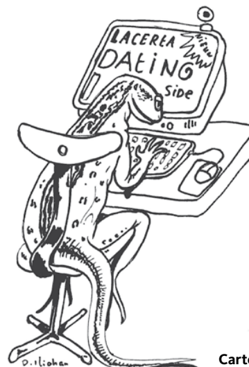
Cartoon: Dik Iliohan