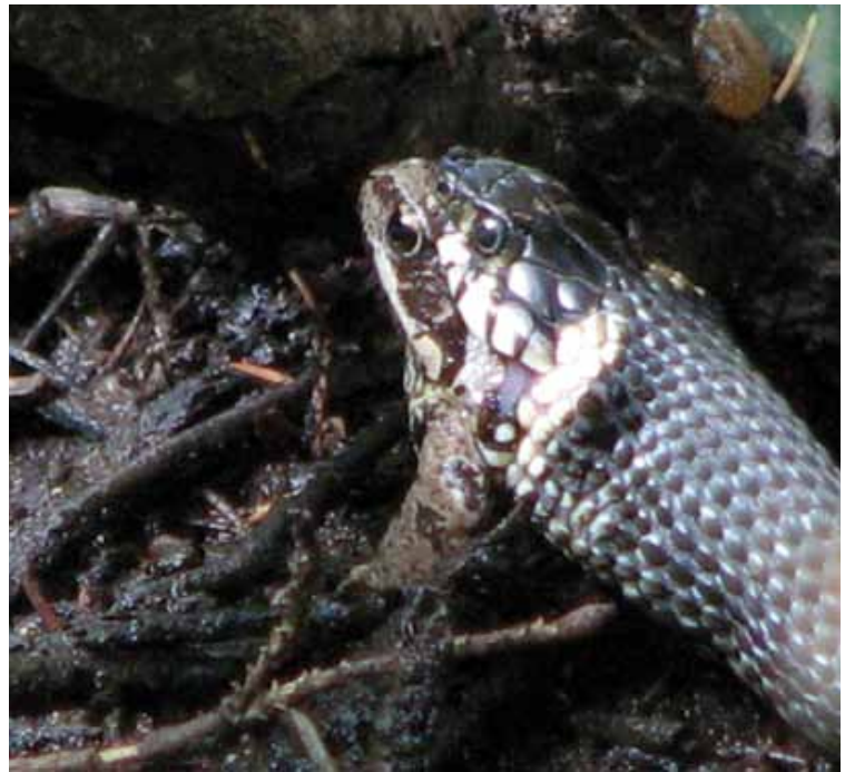
Ringslang eet bruine kikker