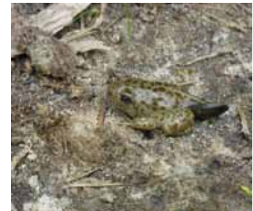
Een van de eerste jonge knoflookpadjes die in 't Hurkske het land op kwam