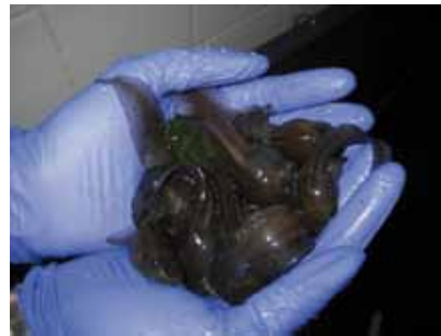
De larven groeien als kool, sommigen bereiken een lengte van meer dan 12 cm voordat ze worden uitgezet!