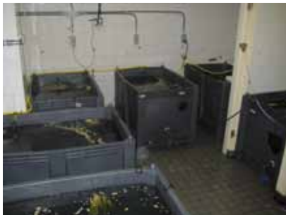
In de kweekruimte staan 16 grote watertanks waarin de larven vanaf een lengte van 1,5 cm worden opgekweekt