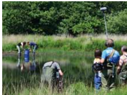
De herintroductie van de knoflookpad in het Rauwven in 't Hurkske werd door Vara Vroege Vogels gefilmd. Op 10 september 2013 is een item over het project uitgezonden