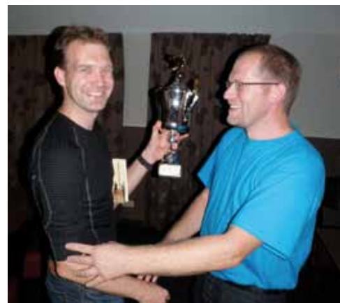
Sfeerimpressie van het Vissenweekend 2013