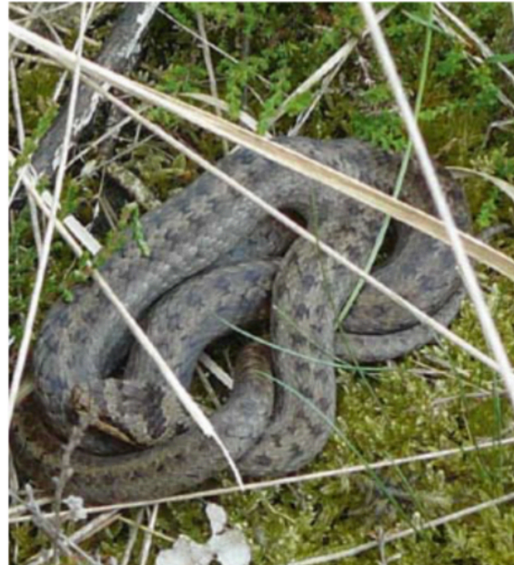
Gladde slang met vage tekening

Behalve dat bij gladde slangen de vorm van de tekening kan