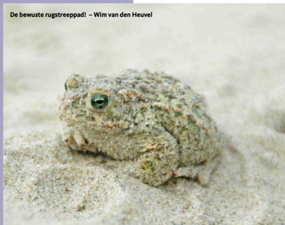
De bewuste rugstreppad! – Wim van den Heuvel