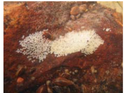
Nest van Pontische stroomgrondel