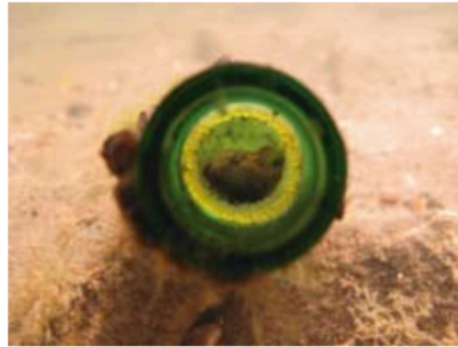
Marmorgrondel waakt in bierfles