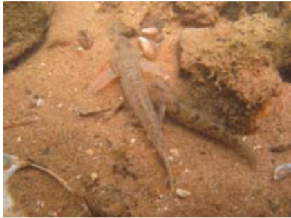
Pontische stroomgrondel man en marmorgrondel man