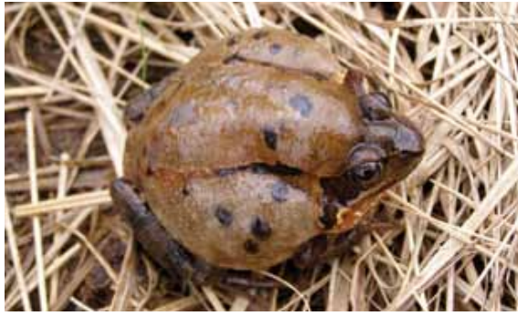
Bruine kikker met hydrops gevonden op de Veluwe (3-4-2008)

Een Natuurbericht van 13 juni 2010 ging over een kleine watersalamander met deze ziekte. Via onze regiocoördinator Gerrit Kolenbrander ontvingen we in september 2010 twee fraaie foto's van een rare, reeds overleden kikkervis. Hij had de foto's ontvangen van de heer Niphuis uit Vriezenveen die gealarmeerd was door zijn buurman. Het was een groene kikkervis met hydrops en de heer Niphuis heeft het exemplaar gestuurd naar het Zoologisch Museum Amsterdam (nu NCB Naturalis) waar het is opgenomen in de wetenschappelijke collectie. In april 2008 ben ik zelf een bruine kikker tegen gekomen met de aandoening.