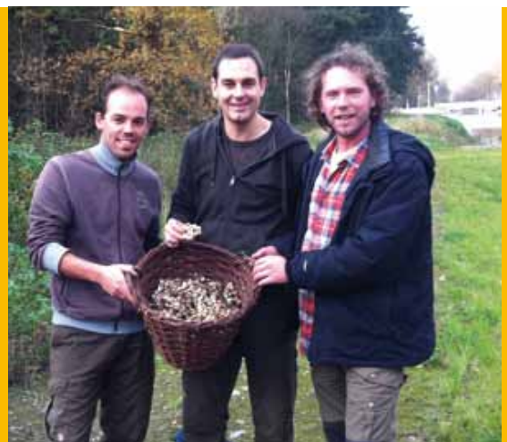
In 2011 moesten de mannen uit Zuid-Holland het vuile werk in Veenhuizen opknappen 🐸