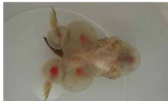
Larf van een groene kikker uit Vriezenveen, gevonden in een tuinvijver