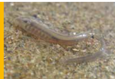
De genoemde rivierprik die zichzelf op de kant probeert te zwemmen.

het wel beter weten. Ik maak nog een foto want ik wil toch wel graag weten wat het is. Inmiddels is duidelijk dat het om een rivierprikje gaat.