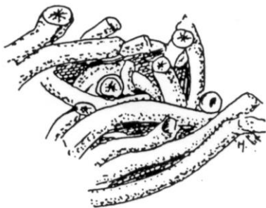
Een stukje Dendrophyllia -koraal, ware grootte.

Daar staan we om half zeven diezelfde avond nog maar op de onderste ervan met ingehouden adem stil. Op ongeveer 25 m afstand lopen twee Kraanvogels al pikkend tussen het halfhoge gras die zich totaal niet bewust