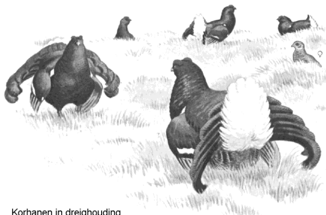
Korhanen in dreighouding

Zanglijsters zijn hier beter vertegenwoordigd dan bij ons, want op tal van plaatsen was zijn melodieuze zang in de bomen te horen. Een bijzondere ervaring was de Geelgors, die helaas in onze omgeving geheel is uitgestorven, maar daar nog op