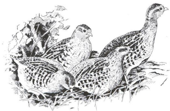
Patrijs Perdix perdix

De Bosrietzanger deed op 5 mei de Rozendel aan en liet met zijn uitbundige zang duidelijk horen dat hij terug was. Helaas was zijn komst daar van korte duur. Bij de volgende bezoeken was hij vertrokken.