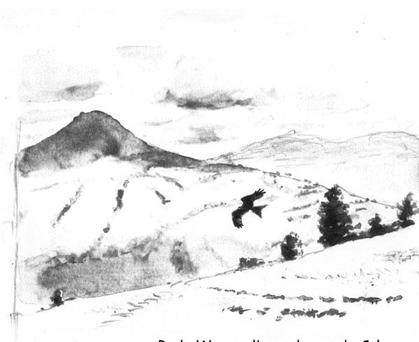
Rode Wouw, vliegend over de Col

Degenen, die daartoe aanwijzingen gaven, bleken te behoren tot een groep vaste waarnemers, die daar min of meer in ploegenverband inventariseren in de periode van begin juli tot en met half november. Voor hen is vlakbij een eenvoudig hutje gebouwd, waar men kan overnachten.