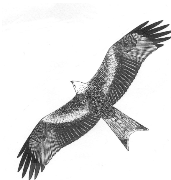
Rode Wouw (bovenzijde)

Als je 's morgens eerst naar vogels hebt gekeken heb je daar allerlei mogelijkheden om de dag op een geheel andere manier af te sluiten.