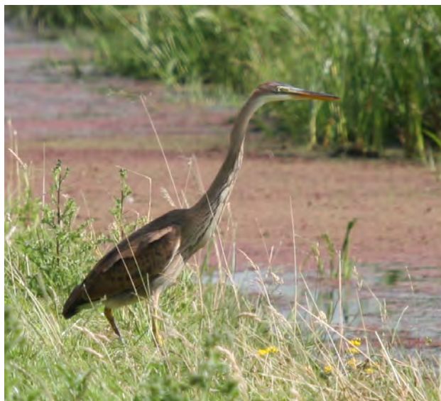
Purperreiger Leidse Vaart.