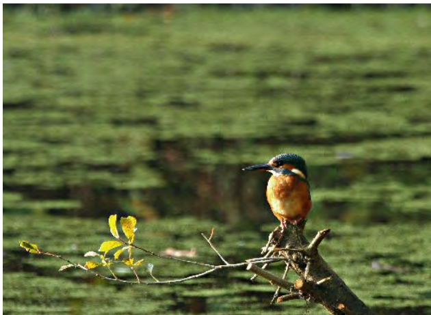
IJsvogel Nieuw-Leeuwenhorst.

Grote kans dat zich hier ook in de komende maanden IJsvogels op zullen houden. Wellicht duiken ze ook nog op andere plekken op.