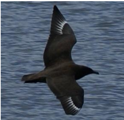
Grote Jager

Zeetrek kijken in de herfst levert een goede kans op om jagers te zien. Van oudsher voeren Kleine Jagers de boventoon. Maar de laatste jaren klinkt in de zeetrekhut regelmatig de verzuchting van waar toch die Kleine Jagers zijn gebleven. Ze worden nog maar weinig gezien. In Noordwijk kijken Jelle van Dijk en anderen al sinds 1972 naar zeetrek. Een lange reeks, waar we het huidige voorkomen van Kleine Jagers tegen af kunnen zetten. Uitgezet in een grafiek blijken er, goede en slechte jaren te zijn voor Kleine Jagers. Dat is niet verwonderlijk, want niet elke herfst is hetzelfde wat betreft weersomstandigheden. Vooral dagen met stevige of stormachtige wind uit westelijke richtingen leveren veel jagers. En het ene jaar waait het nu eenmaal meer dan het andere. Ook is van jagers bekend, dat de aantallen van jaar tot jaar nogal kunnen variëren vanwege verschil in succes van het broedseizoen.