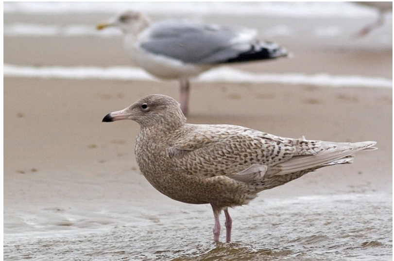
Grote Burgemeester 12 jan.

aan op het strand, onder andere Amerikaanse zwaardscledes en zeesterren. Dit had een grote aantrekkingskracht op meeuwen. Tijdens de watervogeltelling rond het midden van de maand zaten er duizenden meeuwen op het strand: 3000 Zilvermeeuwen tussen Katwijk en Noordwijk, 6000 tussen Noordwijk en de provinciegrens. Ook Kokmeeuwen (2000 Katwijk-Noordwijk, 2500 noord van Noordwijk) en Stormmeeuw (bijna 3000 ten