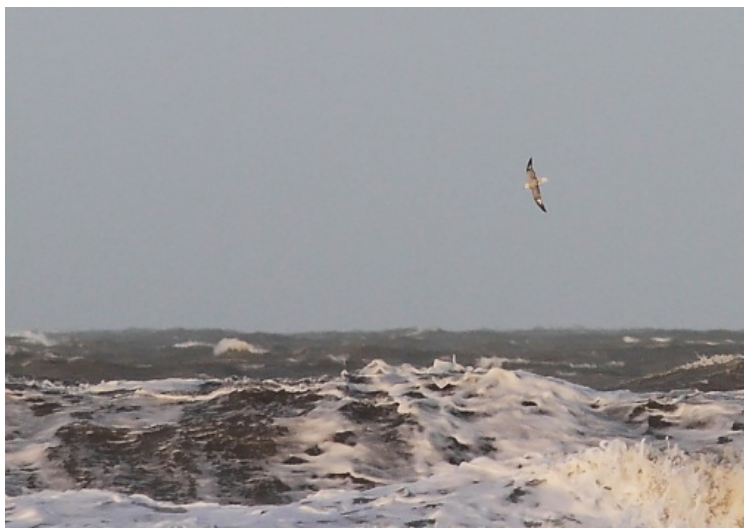
Noordse Stormvogel 7 jan.

De zeetrekters begonnen op 1 januari met een nieuwjaarsbakkie in de zeetrekhut. Een Drieteenmeeuw (RR) kwam op het strand voor de hut er even gezellig bij zitten. Boven zee lag een dichte mist, maar desondanks lukte het om twee onvolwassen Middelste Jagers (JD) op te pikken. Na de stormachtige decembermaand waren deze blijven hangen. De hele maand waren er nog vogels aanwezig, met de laatste waarneming op 28 januari. De storm van 3-5 januari bracht behalve veel Middelste Jagers (max. 4 op de 4 e JD) ook Grote Jagers (max. 7 op de 5 e JD) en Noordse Stormvogels (max. 20 op de 4 e JD), waaronder enkele van de donkere fase. Na het luwen van de storm kwam het pas echt los met 127 Noordse Stormvogels op 7