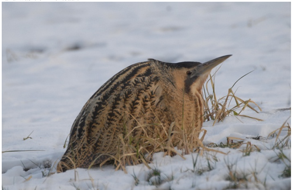
Roerdomp 10 febr.

Bij de Uitwatering verzamelden zich steltlopers op de vlucht voor de vorst