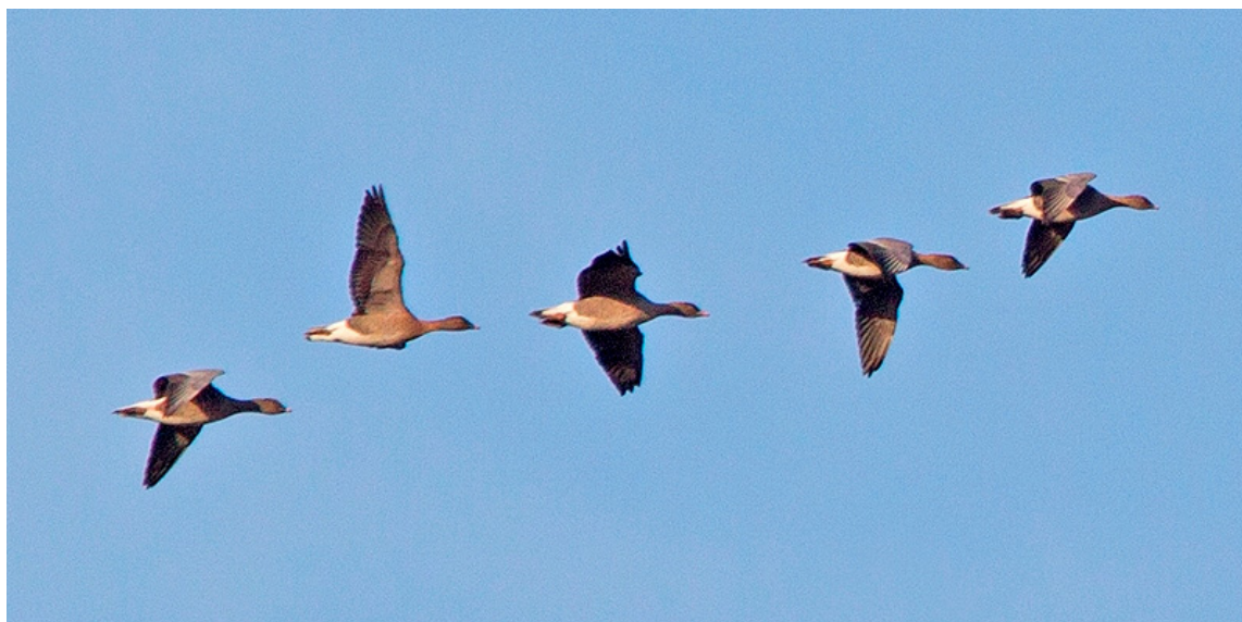
Kleine Rietganzen 10 jan.

De eerste terugtrek van Kleine Rietganzen januari vanuit de overwinteringsgebieden in België, was al op 2 januari te zien met 280 over zee (JD) en 200 over Grashoek (ID). Een overwinterende Bonte Kraai was weer aanwezig in de AWD (2 jan JW t/m 21 jan AP). Op 6 januari verbleef een winterse Witte Kwikstaart samen met een Grote Gele Kwikstaart in de zuidwesthoek van Polder Hoogeweg. Op 29 en 30 januari was een vrouwtje Krooneend aanwezig op de vijver van Nieuw-Leeuwenhorst (HV). In het bos zat op de 29 e ook een Appelvink (CZ).