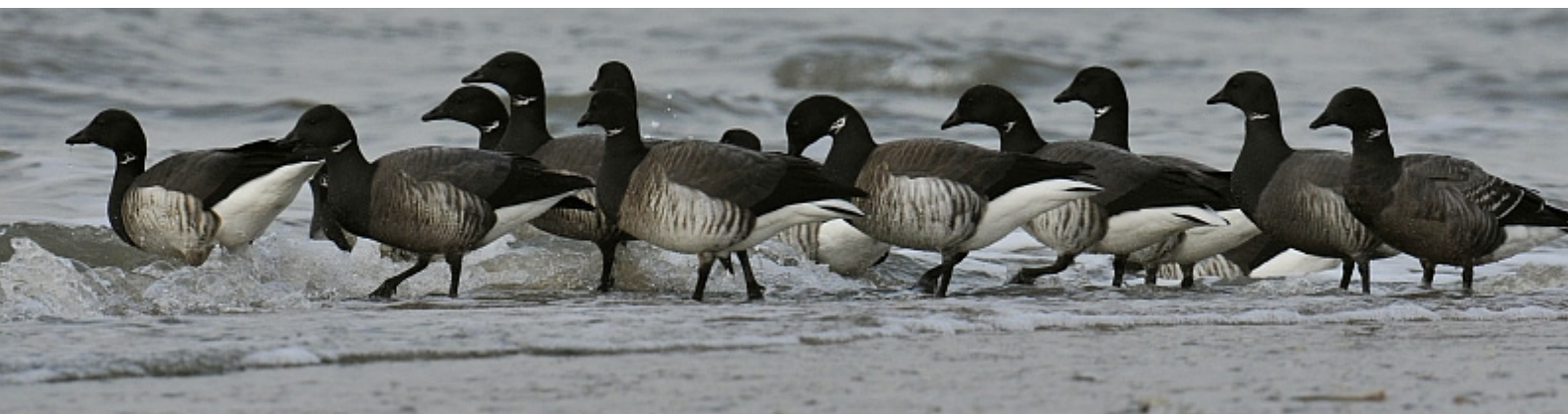
Witbuikrotganzen 5 febr.