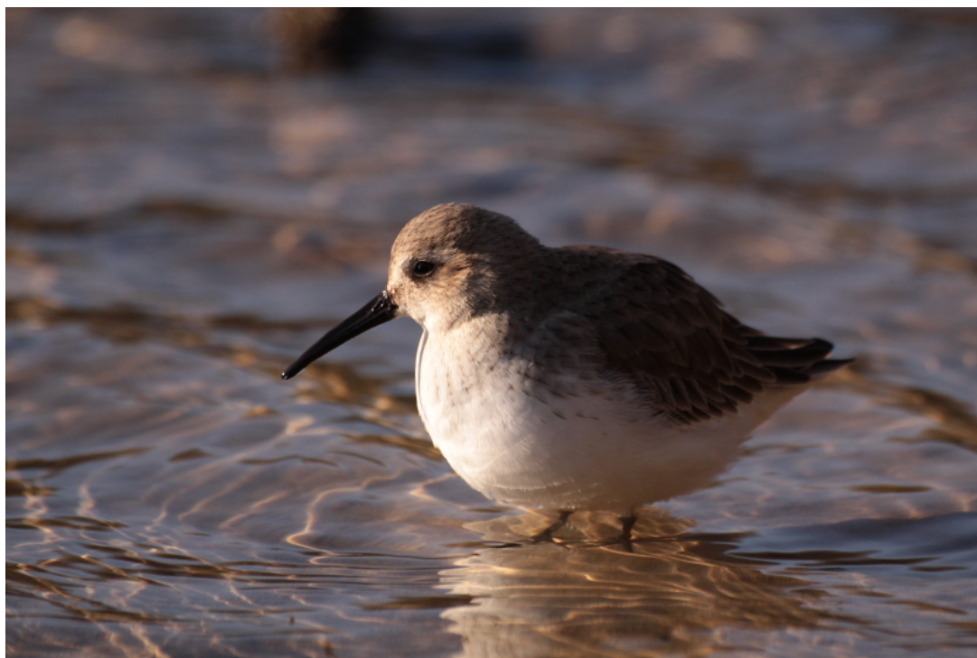
Bonte Strandloper 2 febr.