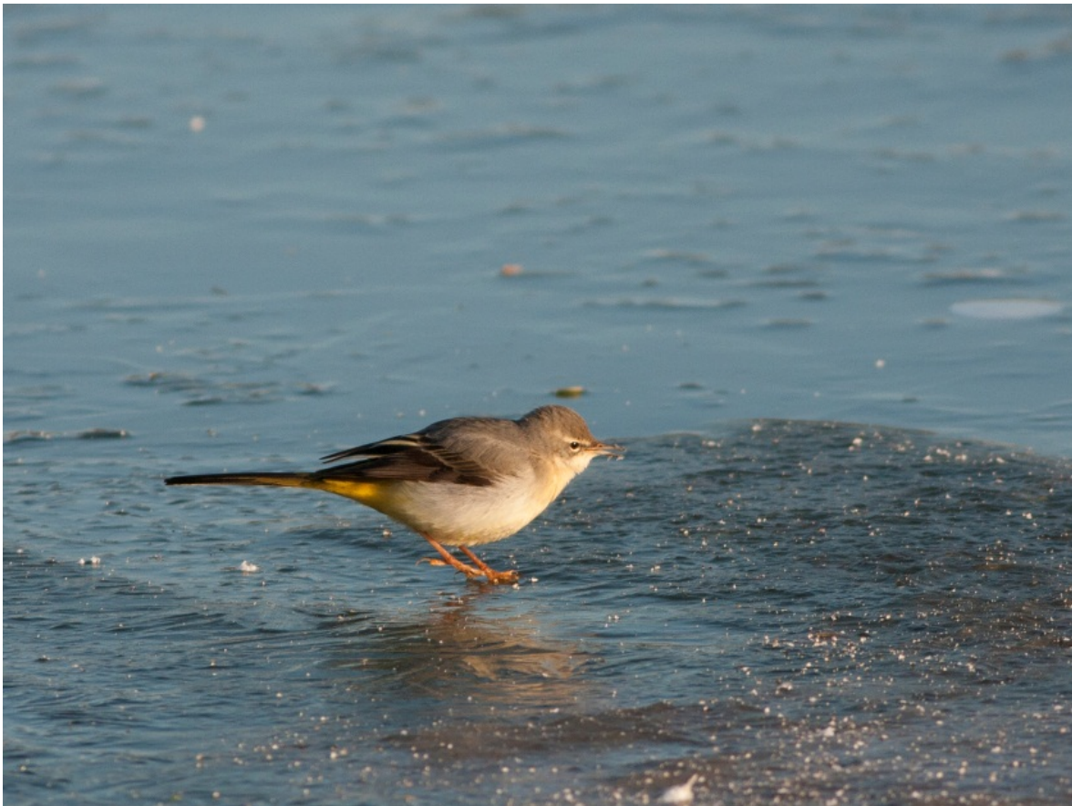
Grote Gele Kwikstaart 11 febr. AWD