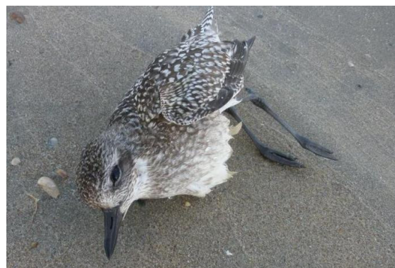
Zilverplevier 7 febr.

allerlaatste moment. Dankzij een zender was een vogel van het Balgzand op zijn vlucht te volgen. Hij raakte uiteindelijk verzeild in de haven van Scheveningen, waar hij het leven liet. Of de Wulpen die al eerder langs trokken een betere keus hebben gemaakt, is nog te bezien. De vorst heeft hen binnen het bereik gebracht van de geweerlopen van Franse jagers. Een in alle opzichten slechte winter voor steltlopers.