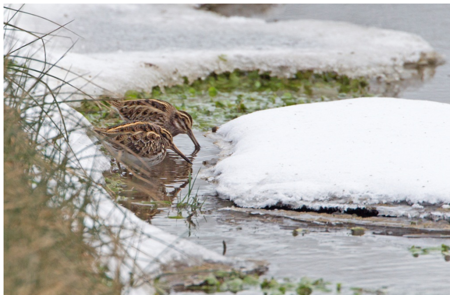
Bokjes 5 febr.

strand van de Noordduinen de twee soorten bij elkaar. Van de Kleine Burgemeester was er deze winter een ongekende influx. Niet alleen in Nederland, maar ook in Scandinavië en het Verenigd Koninkrijk werden er 5 tot 10 keer zoveel vogels gezien als in andere jaren. Waarschijnlijk zijn deze Kleine Burgemeesters afkomstig van Groenland, waar ze broeden en normaal gesproken ook overwinteren. Het vermoeden is dat voedselgebrek in deze overwinteringsgebieden ze verder heeft doen uitzwermen dan normaal. Meestal zijn het de eerstejaars vogels die ons land bereiken, maar dit jaar waren er ook opvallend veel oudere vogels. Dat zagen we ook rond Noordwijk. In totaal zijn er minimaal 4 verschillende vogels gezien: één eerste winter, twee tweede winters en één bijna volwassen. Dit is een minimum, want afgezien van de leeftijd zijn er vaak weinig aanknopingspunten om individuen uit elkaar te houden. Wel lijkt het er op, dat de spierwitte tweedejaars vogel die op 8 januari voor het eerst bij Katwijk is gezien, langere tijd in onze omgeving is