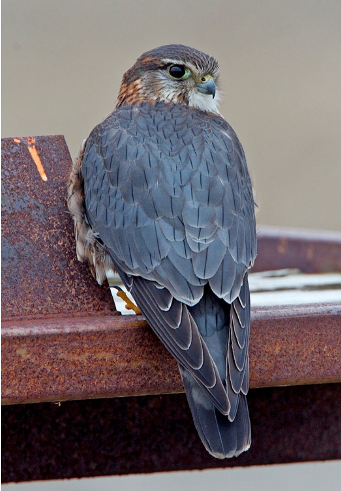
Smelleken 27 febr.

Elsgeesterpolder (RR). Ondanks de barre omstandigheden van het begin van de maand was het broedseizoen niet heel ver weg. Op 10 februari verbleef een Kleine Bonte Specht in de AWD bij Sasbergen (RD). Annelies Marijnus hoorde de eerste zingende Boomleeuwerik in de AWD op 26 februari (AM). Op 28 februari zong de Grote Lijster op de St Bavo (MW).