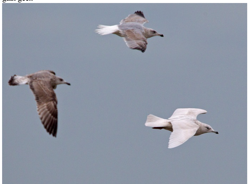
Kleine Burgemeester 9 jan

Maar het was vooral een uitzonderlijke winter voor burgemeesters. Velen hadden deze winter het geluk een Kleine of Grote Burgemeester, of zelfs beiden te zien. Meeuwenkenner Mars Muusse zag op 12 januari op het