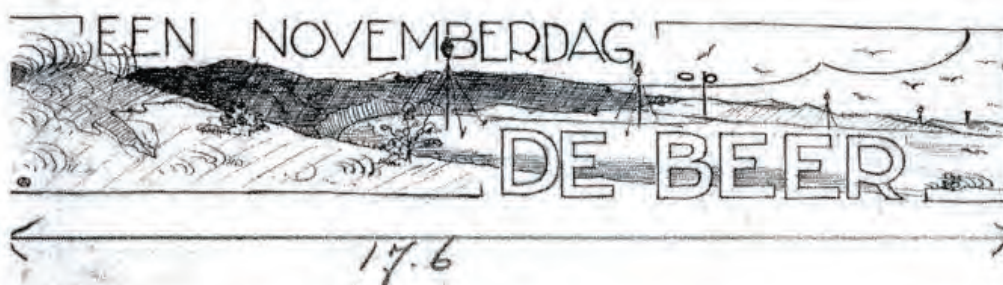
Origineel van de tekening die Anton van den Oord maakte als kop voor het artikel 'Een novemberdag op De Beer' van Simon de Waard in het tijdschrift De Wandelaar in 1936.