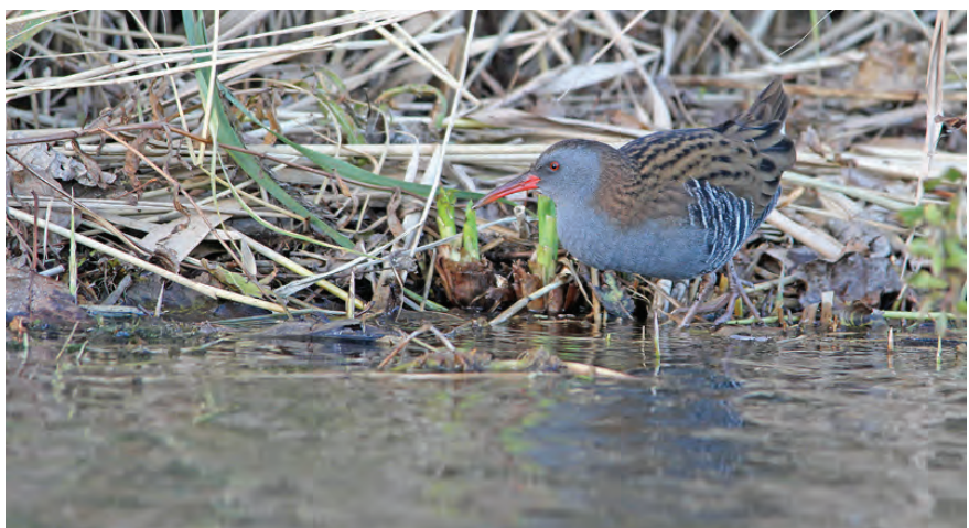
Waterral 27 okt. 2012 Zwarte Pad Katwijk

die Maarten Wielstra op 17 oktober ontdekte bij de St Bavo, was alleen weggelegd voor de vogelaars die dezelfde middag waren toegesneld. In oktober vonden oplettende vogelaars op maar liefst 8 verschillende plekken Bladkoningen (AS, CZ ea). Op 7 oktober hing een Roodkeelpieper rond in de omgeving van de Driehoek (CZ). De maand bracht ook de laatste waarnemingen van zomergasten van het seizoen, o.a. Grauwe en Bonte Vliegenvanger op 6 oktober (RR, CZ), een Sprinkhaanzanger op 20 oktober