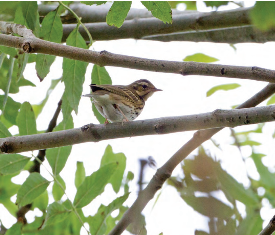
Siberische Boompieper 17 okt. 2012 St. Bavo

De enige goede dag voor stormgasten van dit kwartaal was 5 oktober. In de middag vlogen er 5 Grauwe Pijlstormvogels en een Noordse Pijlstormvogel langs de zeetrekhut (AS ea). Daarna verschenen er nog maar sporadisch pijlstormvogels: een Noordse Pijlstormvogel op 6 oktober (JD) en twee Grauwe Pijlstormvogels op 29 oktober (JD) en 6 november nog één (HV). De noordenwind van 8 oktober bracht een recordaantal van 1290 Rotganzen (JD). Dit was bijna een verdubbeling van het eerdere uurmaximum voor de najaarsmaanden. Die dag was