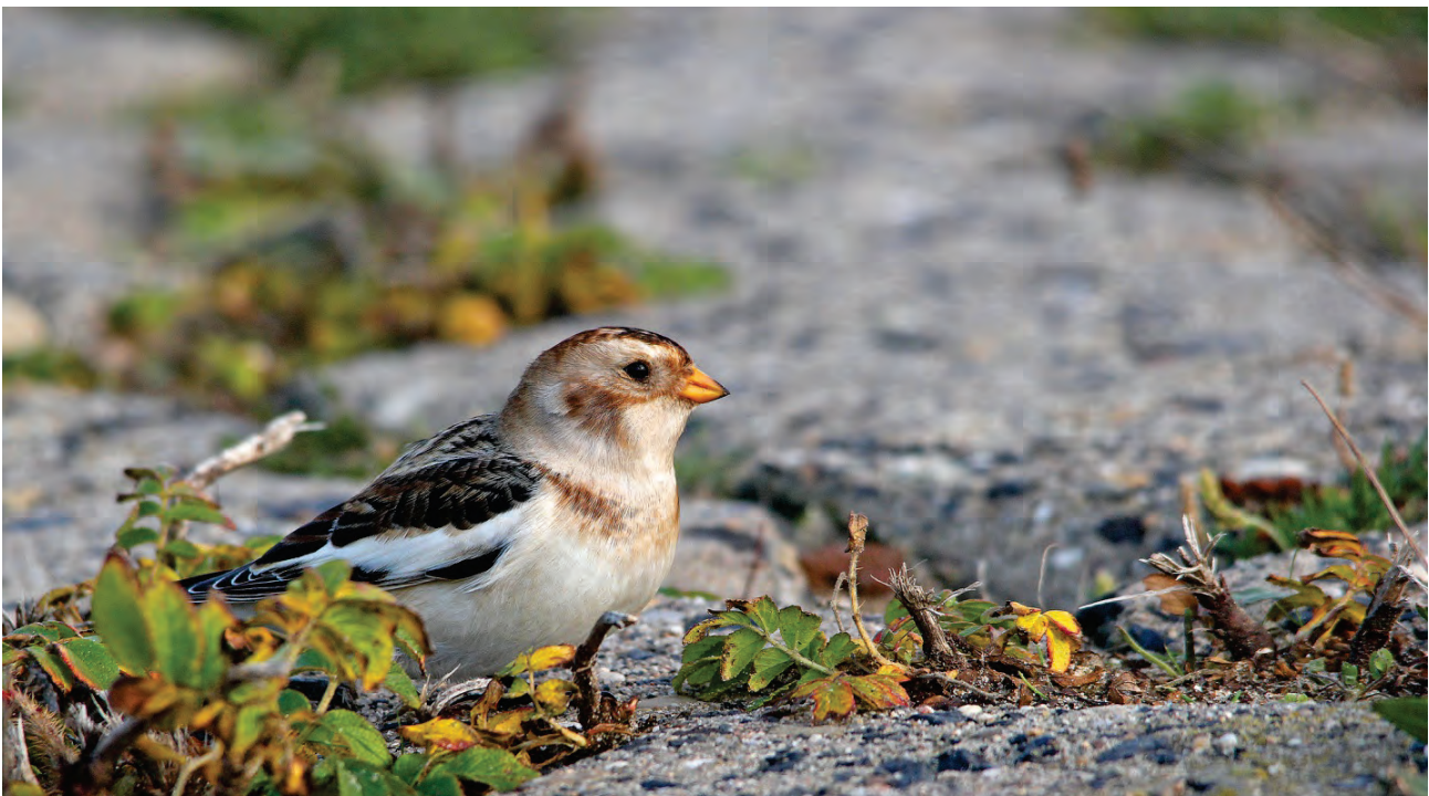
Sneeuwgors 8 nov. 2012 Uitwatering Katwijk