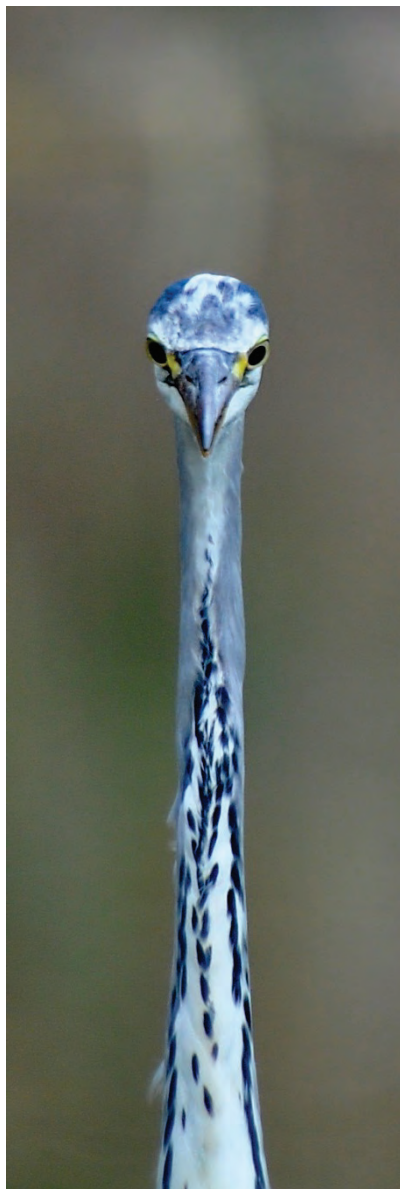
Blauwe Reiger 24-10-2012 Zwarte Pad Katwijk