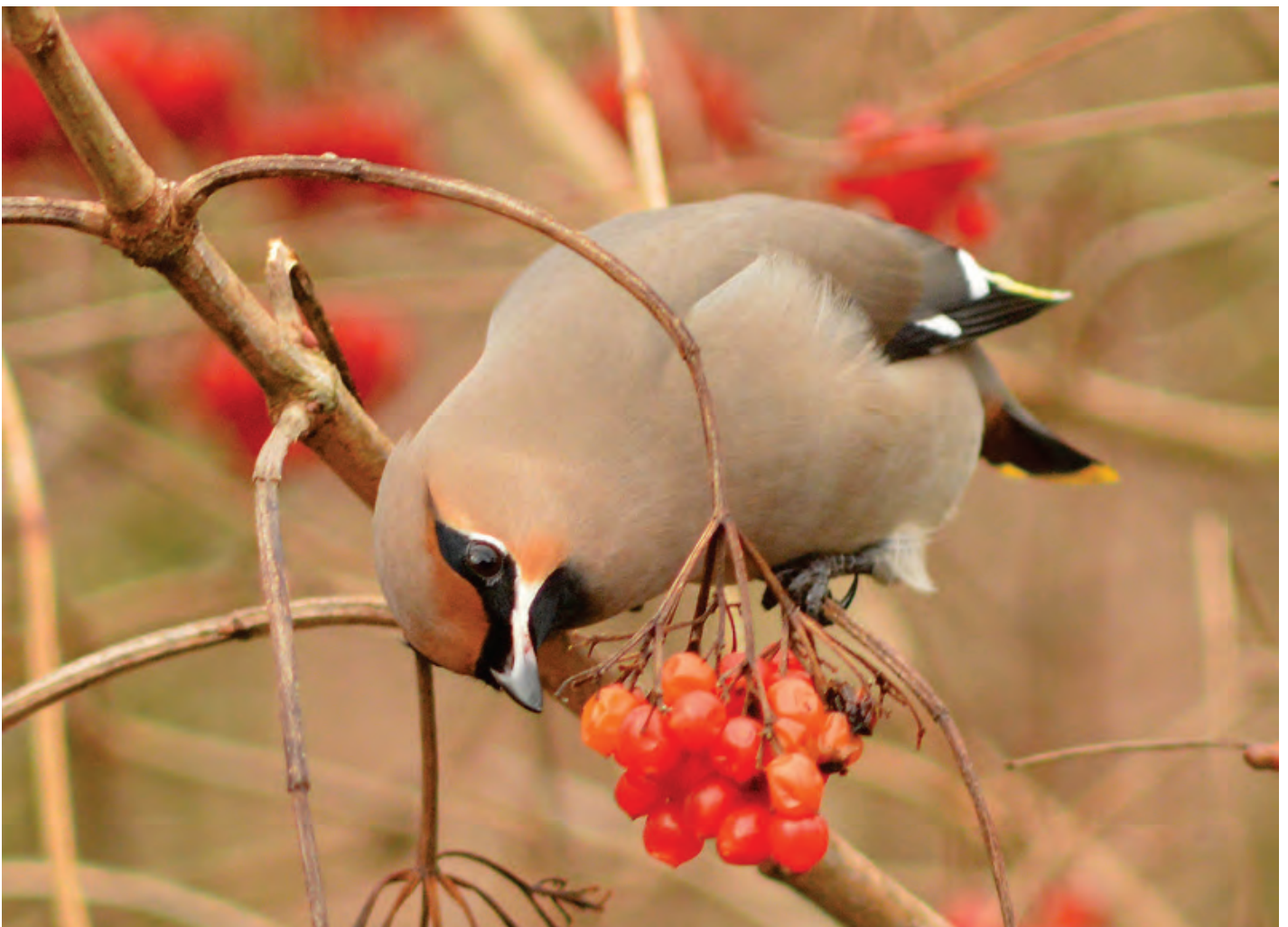
Pestvogel 15-12-2012 Noordwijkerhout

Tjiftjaffen waren tot 11 december op verschillende plekken in de bebouwde kom te zien, met 2 vogels op 11 december in Rijnsoever Katwijk (AM).