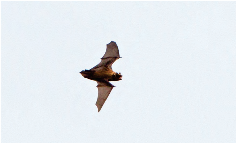
Rosse Vleermuis 17 okt. 2012 Noordwijkerhout

(MD) en een Kleine Karekiet op 22 oktober (AS), beide in de Coepelduynen.