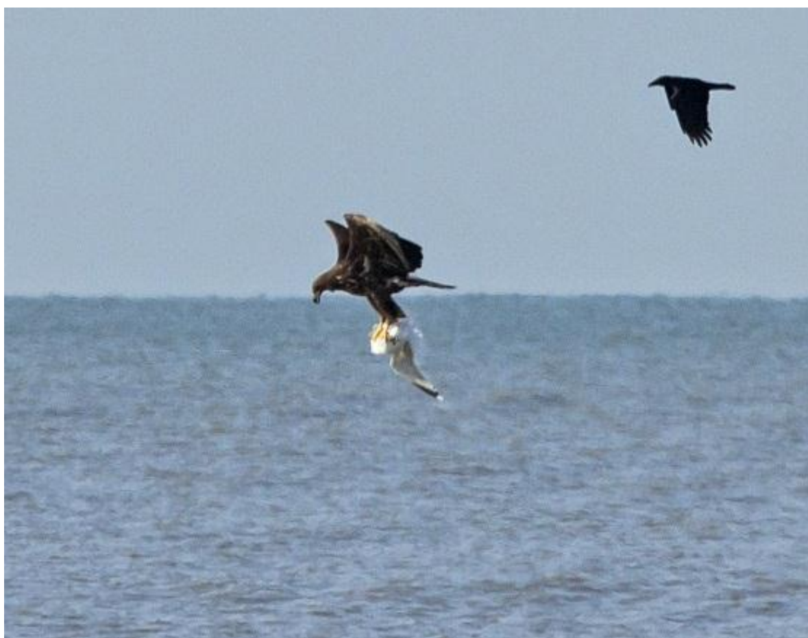
Zeearend Uitwatering Katwijk 13-2-2013

Wellicht dat in komende jaren er opnieuw af en toe een vogel rond Noordwijk verzeild raakt. De meeuwen zullen er niet blij mee zijn.