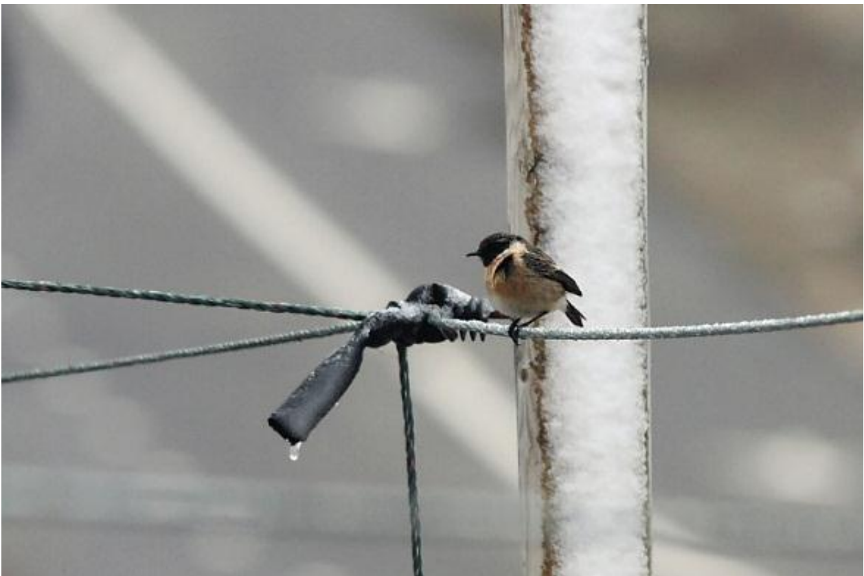
Roodborsttapuut 10-3-2013 De Puinhoop Katwijk