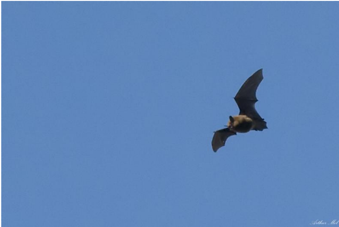
gewone dwergvleermuis AWD 4-3-2013

In de zachte periode aan het begin van de maand kwamen de eerste Gewone Dwergvleermuizen uit winterslaap. De eerste vloog op 4 maart in de AWD (AMo). Op 10 maart vond Bart Noort in de sneeuw sporen van een Bunzing in het Achterhaasveld in de AWD (BN). Een jonge Gewone Zeehond verbleef het hele kwartaal rond de Uitwatering van Katwijk en zwom regelmatig de Binnenwatering in (AM ea).