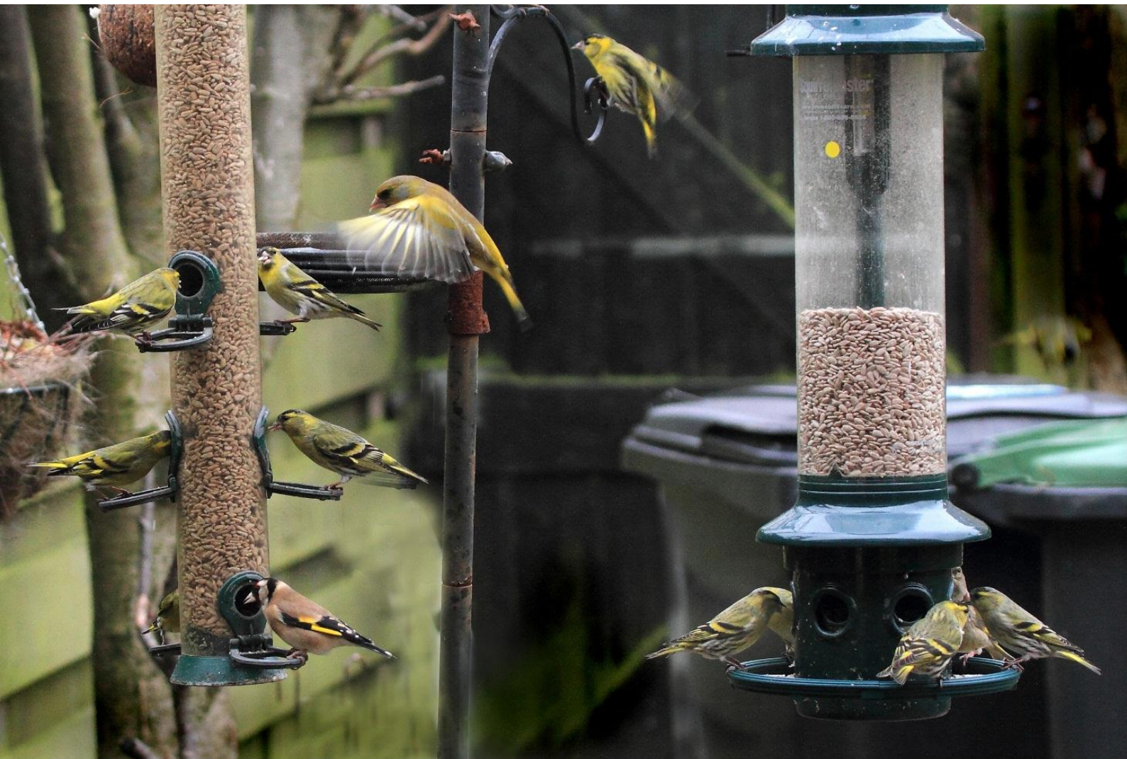
Piet Broekhof had op 23 februari meer dan 10 Sijzen op de voedertafel. Grashoek Noordwijk