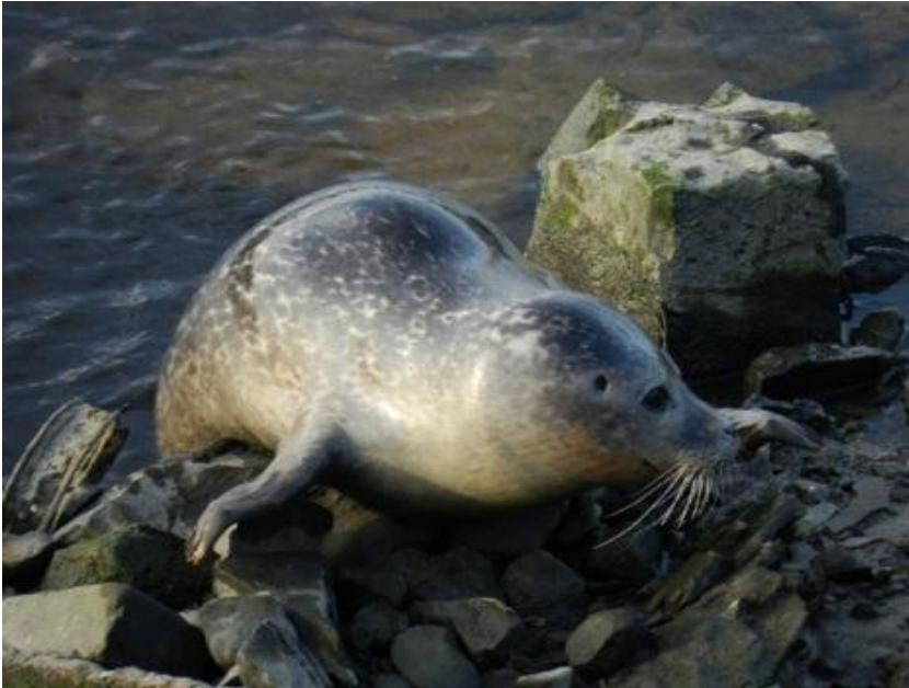
gewone zeehond Binnenwatering Katwijk 12-1-2013