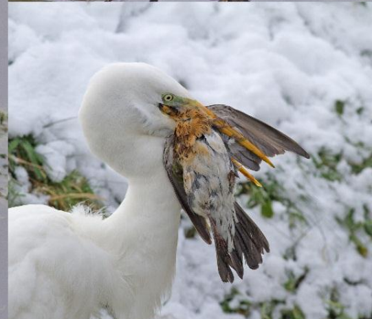
Grote Zilverreiger vangt een Kramsvogel. Middengebied Noordwijk 23 januari 2013