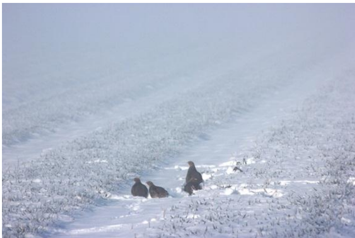
Patrijzen Bronsgeest Noordwijk 16-1-2013

Januari begon en eindigde met een opvallend zachte periode, maar was toch een koude maand. We hadden een lange vorstperiode die op 10 januari begon en pas eindigde op 27 januari. In de nacht van 14 op 15 januari viel er een pak sneeuw. Anders dan we in eerdere winters gewend waren bleef juist het noorden en oosten van het land sneeuwvrij. Op 20 en 21 januari bracht een depressie uit het zuiden opnieuw sneeuw.