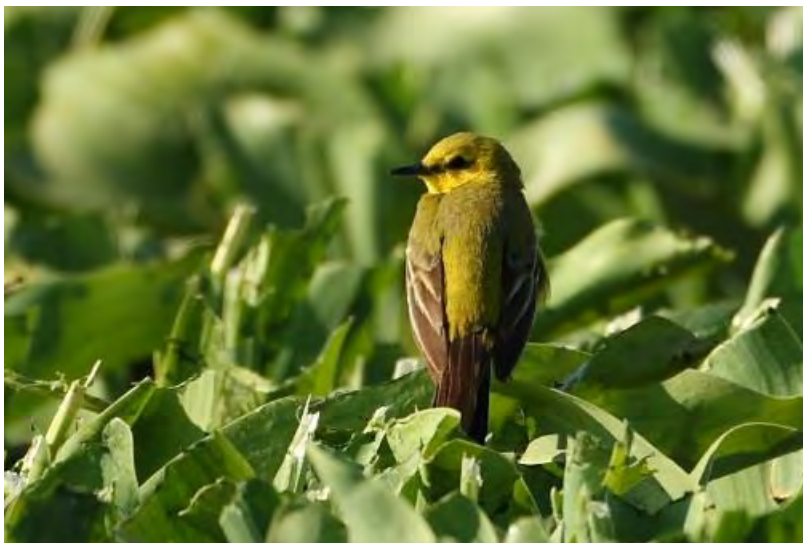
Engelse Kwikstaart Polder Hoogeweg 25 juni

Sommige soorten zitten landelijk in een neergaande trend en het is elk jaar weer spannend of ze zich weten te handhaven. De Engelse Kwikstaart zit er nog steeds. Door het atlasonderzoek bezoek je plekken waar je normaal niet komt en dit leverde, toch wel onverwacht, 4 locaties met in totaal 5 broedparen. In de periode 2004-2008 waren er 7 locaties met in totaal 11 paren. Binnen de atlasblokken bleek hij op alle eerdere locaties nog steeds aanwezig. De aantallen zijn veel lager dan ooit in de jaren zeventig, maar het goede nieuws is dat hij zich toch weet te handhaven. Wat zowel de Engelse als gewone Gele Kwikstaart parten speelt, is dat de teelt van tulpen langzamerhand lijkt te verdwijnen uit de Bollenstreek. Beiden broeden bijvoorbeeld in een tulpenperceel.