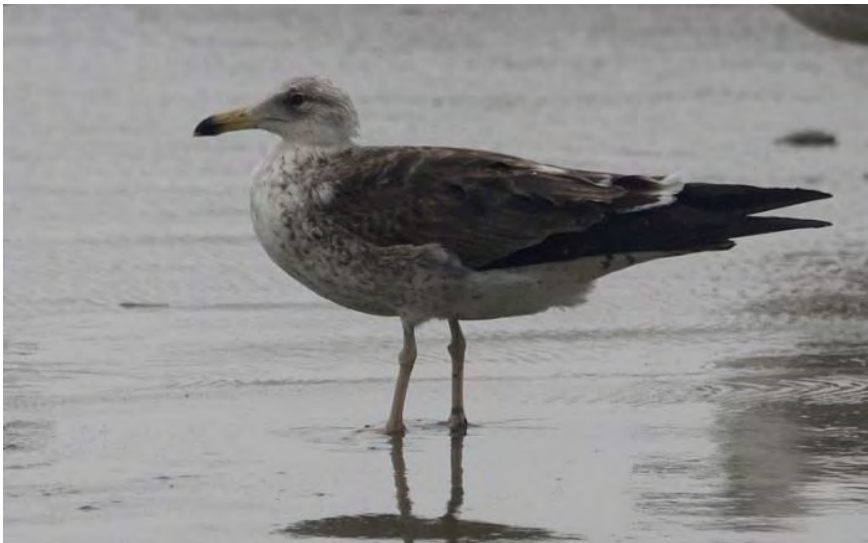
Baltische Mantelmeeuw 22 juni Noordwijk aan Zee - strand

Op 3 juni kwam een Europese Kanarie drinken bij een vijver in een tuin in de Grashoek (LS). Een zeer onverwachte verschijning! Op 8 juni werden er op verschillende plaatsen overvliegende Appelvinken gezien (PS, CZ). Mogelijk markeerde dit het moment dat families met hun jongen begonnen rond te zwerven. Op 11 juni vloog er een late Visarend over Noordwijk aan Zee (CZ), tevens de enige van het voorjaarsseizoen. Op 18 juni zong een Wielewaal op het terrein van de St Bavo (MW), een late doortrekker. Tussen de duizenden meeuwen ontdekten meeuwenspecialisten twee zeldzame Baltische mantelmeeuwen die tussen 16 en 22 juni af en toe aanwezig waren (MK1 e.a.). Dit is de ondersoort