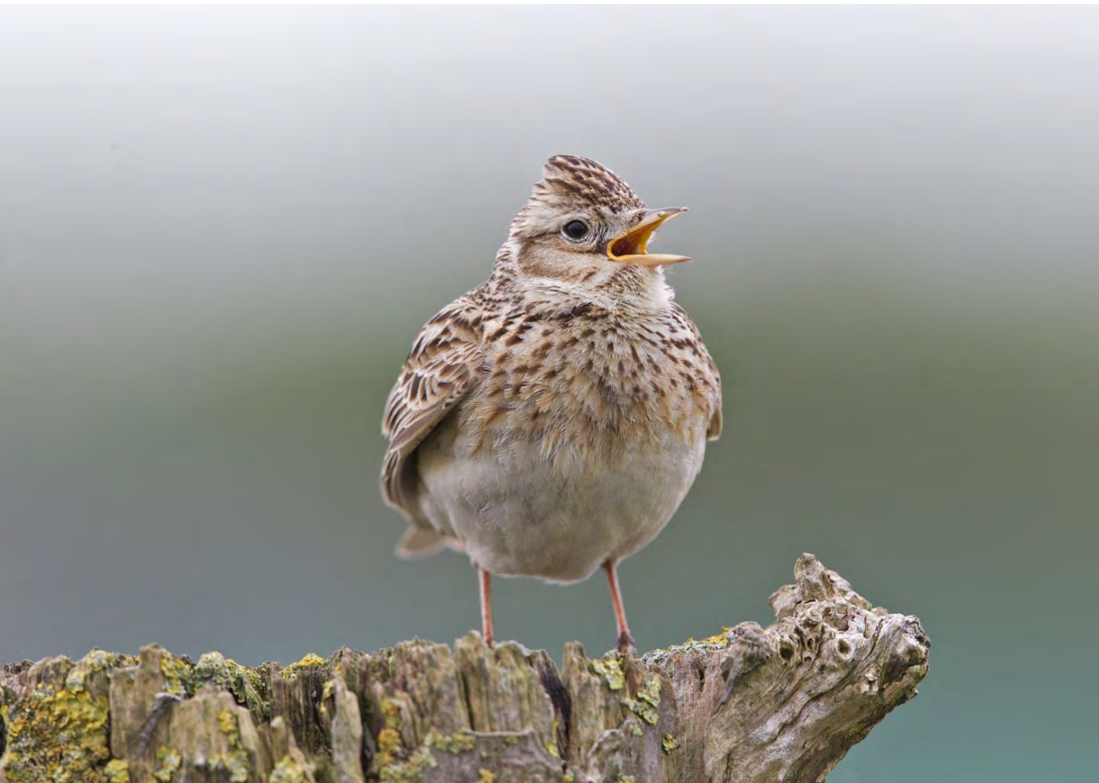
Veldleeuwerik 31 mei Voorhout - Elsgeesterpolder

Een andere soort waar we met zorg naar kijken, is de Zomertortel . Nu ook verdwenen uit het Langeveld, maar gelukkig is hij nog aanwezig in de wijde omgeving van het Oosterduinsemeer. Dat we hier nog minimaal 8 paar hebben, is inmiddels uniek. Eén van de schokkende uitkomsten van het eerste jaar atlasonderzoek is dat de Zomertortel hard op weg is uit Nederland te verdwijnen. In Zuid-Holland is hij alleen in atlasblokken rond de monding van het Haringvliet en in het Rotterdamse havengebied gevonden. En in ons waarnemingsgebied. Het lijkt er op dat het bollenland iets te bieden heeft voor deze duifjes, vooral als daar braakliggende percelen zijn waar ze onkruidzaden op kunnen pikken. Ook voor de Veldleeuwerik is de Bollenstreek inmiddels een bolwerk geworden. Hij doet het hier, in tegenstelling tot veel andere plekken, nog steeds goed. De eerste indruk was, dat hij zelfs wat toegenomen is sinds 2004-2008. De bloemensector heeft het moeilijk en er liggen relatief veel percelen braak. De Veldleeuwerik lijkt hiervan te profiteren. De Patrijs handhaaft zich ook goed, maar aantallen zijn lager dan in 2004-2008. In het atlasblok rond het Oosterduinsemeer (blok 3027) zaten toen nog 11 paar, terwijl de teller nu bij 9 bleef steken. De Patrijs is in dit atlasblok uit de duinen verdwenen, maar in het bollenland blijkt het aantal op peil gebleven. Gezien de sterke landelijke afname is dat geen slecht resultaat.