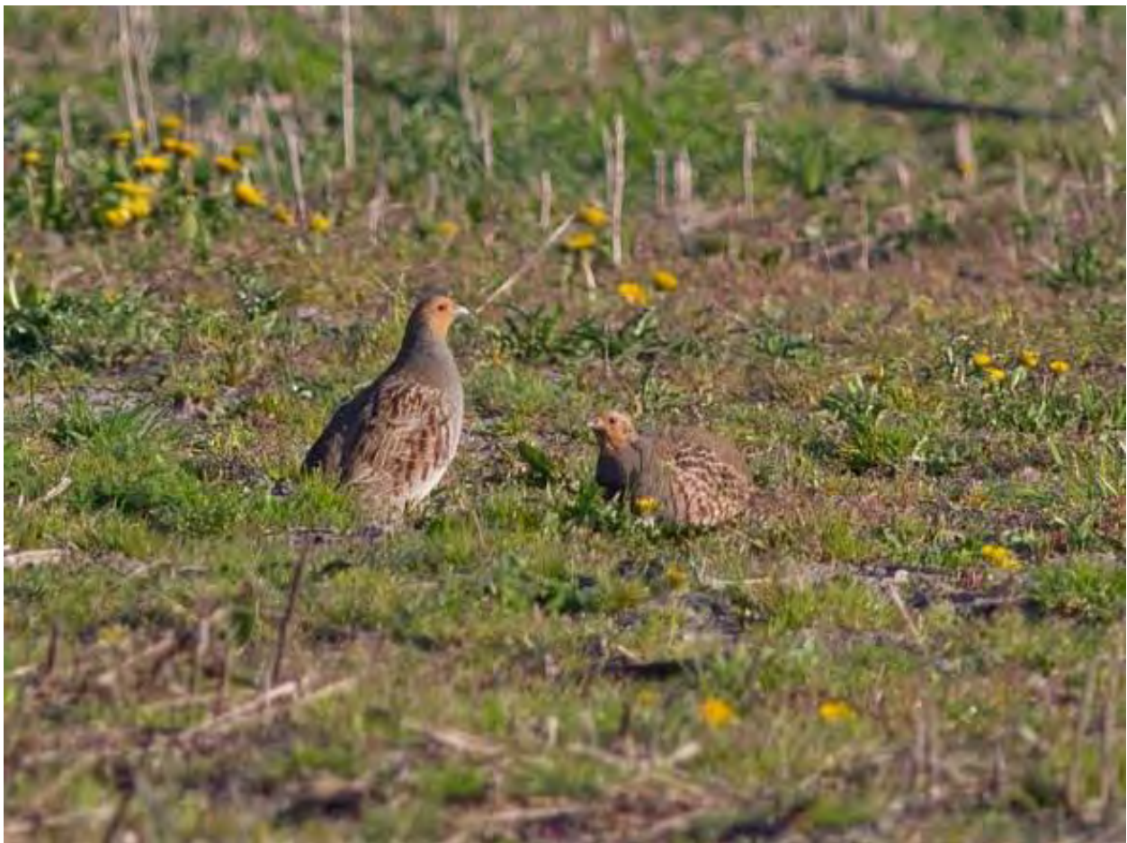
Patrijzen 6 mei Elsgeestepolder