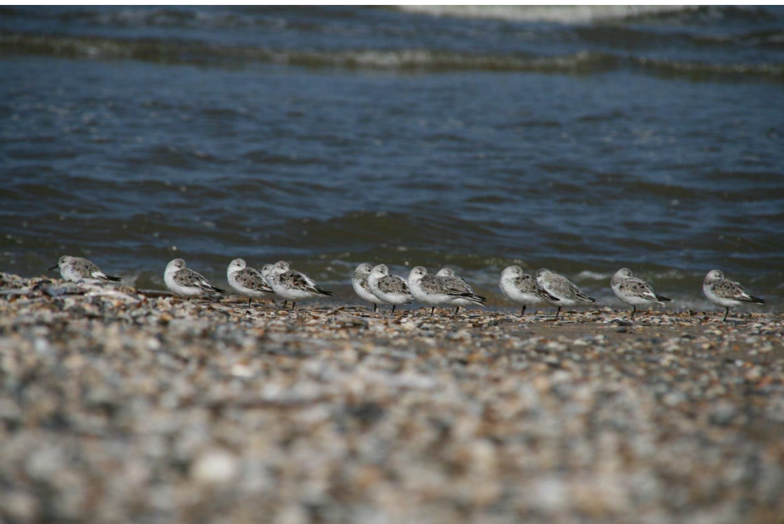
Drieteen Strandlopers 24 april strand Noordvoort