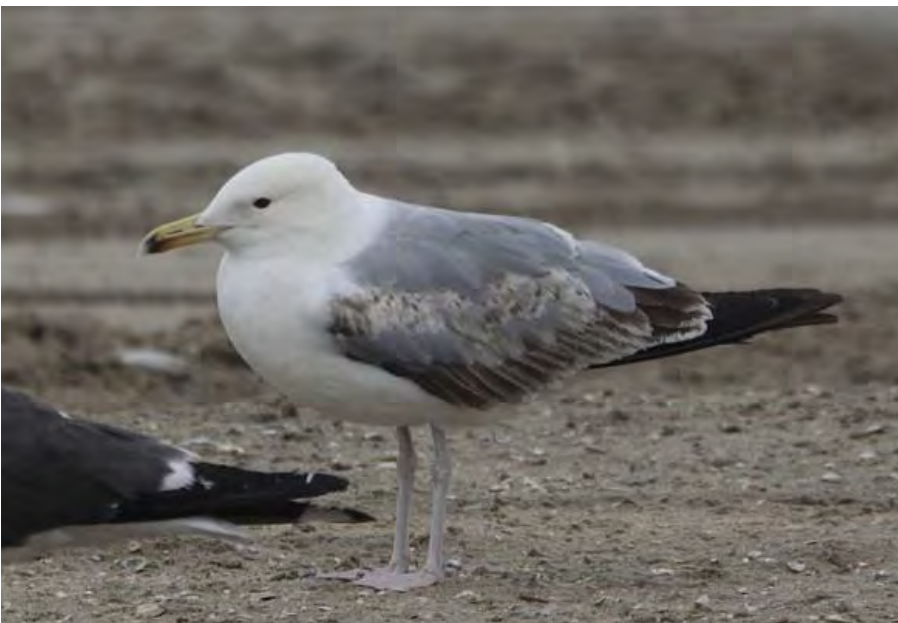
Pontische Meeuw 22 juni Noordwijk aan Zee - strand

Op 25 juni trok de eerste Witgat over Kloosterschuur (MK). Op 29 juni waren alweer 2 Goudplevieren aanwezig in Polder Hoogeweg (JD). Op 24 juni jaagde er een mannetje Bruine Kiekendief in de Elsgeesterpolder, waarschijnlijk een broedvogel vanuit de Kagerplassen (JF).