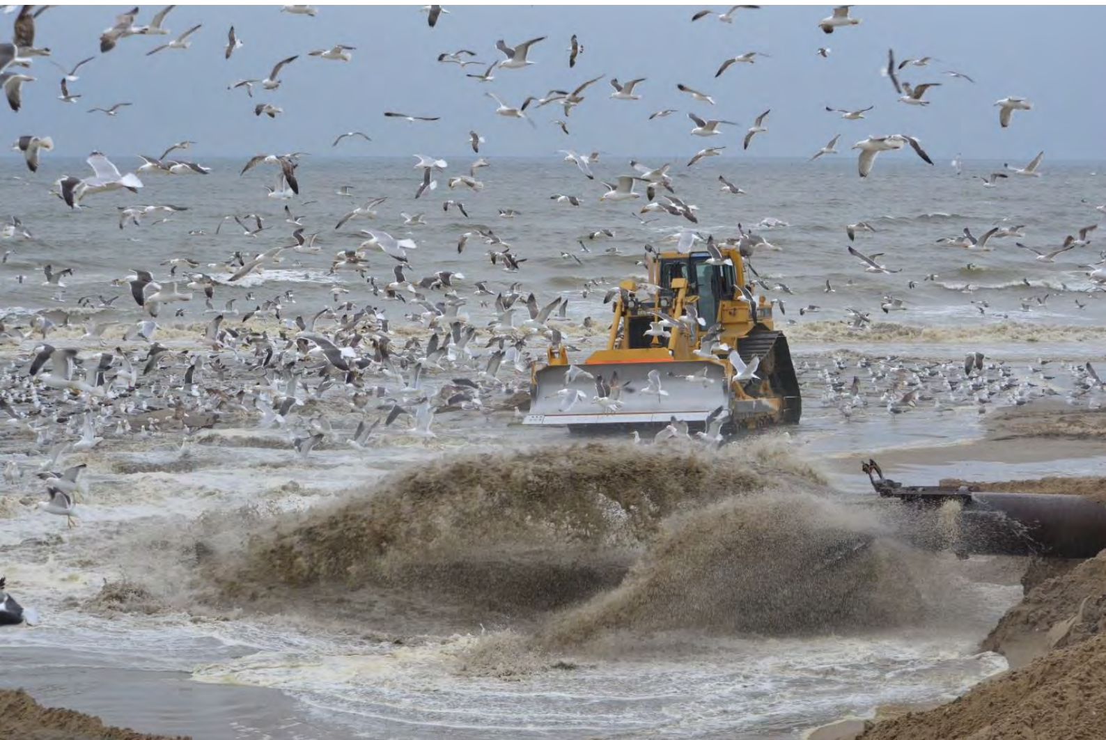
Strandsuppletie juni 2013 Noordwijk