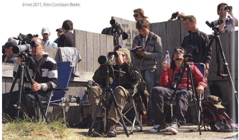
6 mei 2011, foto Corstiaan Beeke.

In 2008 kwam de Vinkenbaan Castricum met een geweldig boek, waarin de resultaten over de laatste 50 jaar waren samengevat (zie de bespreking in de Strandloper maart 2009). De Telgroep Breskens heeft met dit boek een soort standaard gezet voor de verslaglegging van trekresultaten van een bepaalde telpo