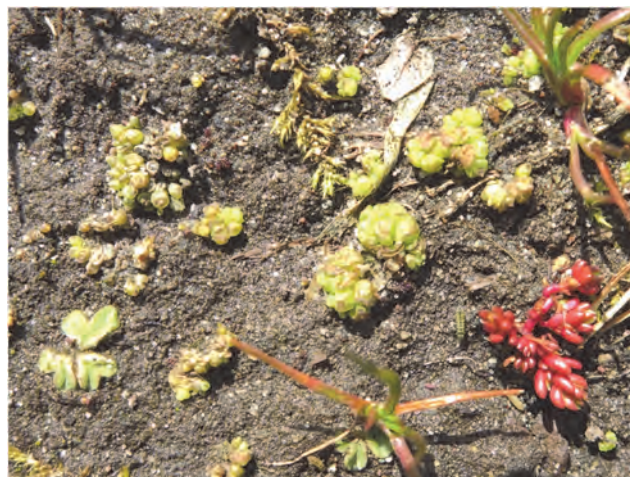
Camping Sollasi (Noordijkerhout): Klein landvorkje (links), Gestekeld blaasjesmos (midden), Mosbloempje (rechts)

Het Gestekeld blaasjesmos bleek aanwezig te zijn op 13 campings. Op elf campings werd materiaal verzameld, om door microscopisch onderzoek na te gaan of het inderdaad deze soort betrof. In alle gevallen bleek het inderdaad om Sphaerocarpos michelii te gaan. Over deze vondsten zal