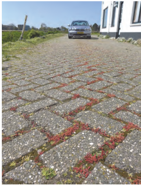
Mosbloempje op de oprit bij café Hof van Breloft (Nieuwe Zeeweg)

zogenaamde gatenstenen zijn in trek, zoals in Hoek van Holland. De plantjes doen het uitstekend in de gaten en de voegen van de bestrating en vormen een fraai patroon in het plaveisel. In onze regio zagen we het Mosplantje behalve op caravanplaatsen ook langs de oprit naar camping "de Noordduinen" (Joop Kortselius), bij de patatkraam van Ruigenhoek (Theo Westra) en op de oprit van café Hof van Breloft in Noordwijk (Coby van Dijk).