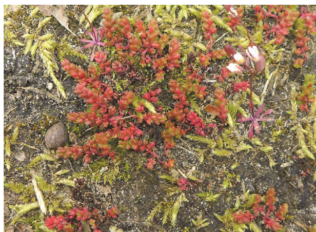
camping Vogelenzang: Mosbloempjes met Vroegeling (rechts)

Het Mosbloempje bleek óók op veel campings te groeien. In onze omgeving ging het om camping Duinrell, camping Sollasi, camping Ruigenhoek en camping Vogelenzang.