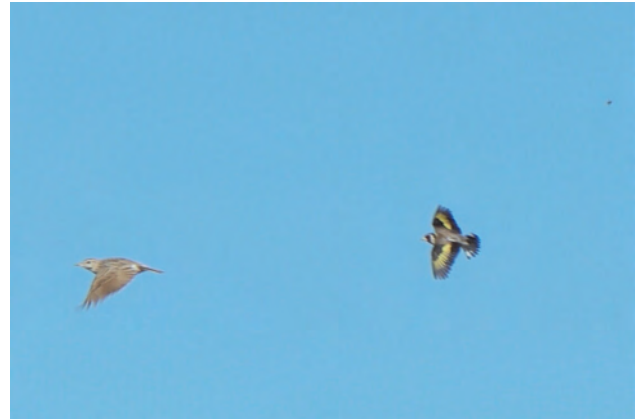
Kortteenleeuwerik en Putter