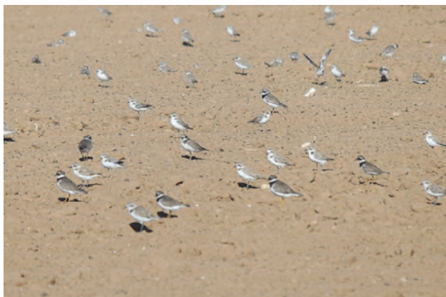
Strand- en Bontbekplevieren

Nadat we vorig jaar in Noord-Spanje op vakantie waren geweest, maar de zonovergotenheid van die vakantie niet groot genoeg was volgens de familie, vlogen we dit jaar daarom naar Zuid-Spanje, Chipiona, in de buurt van Cadiz. Voor mij gold hetzelfde recept als vorig jaar. Her en der in het vakantieprogramma was wel wat tijd beschikbaar om naar vogeltjes te kijken. En als bijkomende nieuwigheid had ik ook een fototoestel bij me, met een bescheiden telelensje. Bijgaand een kort verslag van de vogels van een weinig fanatieke vogelaar, met erbij wat foto's van een startend fotograaf.