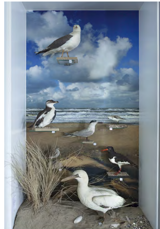
Expositiekast in het nieuwe centrum