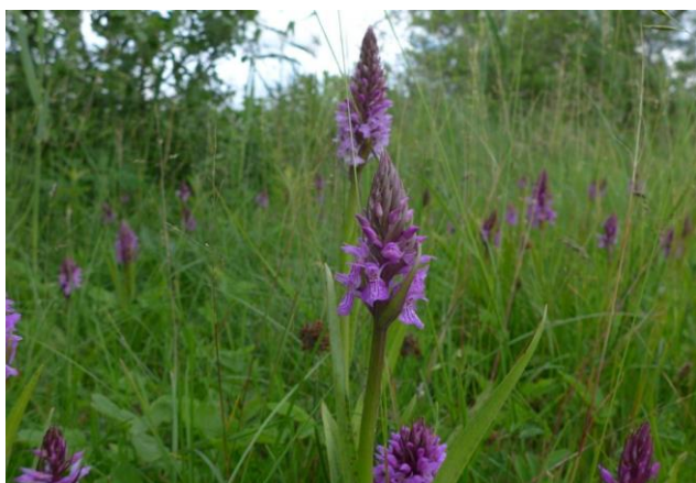
Rietorchis - juni 2015 - Oosterduinse Meer

Ook voor deze dieren is er nauwelijks iets in de nieuwe wet veranderd. Padden, kikkers en reptielen blijven dus beschermd. Ook de vleermuizen en andere zoogdieren behouden hun bijzondere positie wat de bescherming betreft.