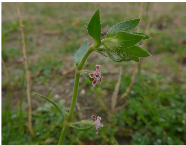
Franse silene - januari 2016 - wijk Boechorst Noordwijk

Uit bovenstaande lijst blijkt dat de meeste soorten te vinden zijn in de duinen. Hun voortbestaan wordt voor een belangrijk deel bepaald door het beheer dat daar gevoerd wordt. Anders ligt het bij soorten die alleen op