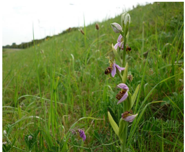
Bijenorchis - juni 2010 - wegberm Noordwijkerhout

slutelbloemen beschermd. Tot de genoemde plantenfamilies behoren ook soorten die echt niet zeldzaam zijn en eigenlijk geen bescherming nodig hebben. Maar omdat verwisseling met een zeldzame, verwante soort nogal eens voor de hand ligt, waren alle soorten uit die families beschermd. Ook soorten die vaak geplukt worden zoals Blauwe zeedistel en Veldsalie stonden tot nu toe op de lijst van beschermde planten. Verder waren de meeste muurplanten beschermd. In de Wet Natuurbescherming is daar een forse streep doorgehaald. Zo is van de muurplanten straks alleen nog de zeldzame Schubvaren beschermd. Van de orchideeën zijn nog slechts vijf soorten op de lijst terug te vinden waarvan er niet één in onze regio te vinden is. Het is dus gedaan met de wettelijke bescherming voor soorten als Rietorchis, Bijenorchis en Hondskruid. Buiten dit lijstje blijft de zeldzame Groenknolorchis beschermd omdat die soort tezamen met Drijvende waterweegbree en Kruiwend moerasscherm op het korte lijstje van Europees beschermde soorten staat.