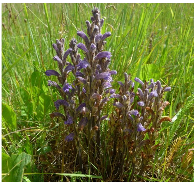
Blauwe bremraap - juni 2014 - terrein Bollenbad

een bouwterrein (Franse silene) of in een wegberm (Engels gras) gevonden worden. Voor zulke soorten is nauwelijks een beleid te voeren waarbij het voortbestaan van deze soorten verzekerd is. Dat zal ook niet gebeuren omdat de als voorbeeld genoemde soorten hier niet 'in hun natuurlijke verspreidingsgebied' te vinden zijn. Bij een soort als de Waterscheerling zal het voortbestaan afhangen van de manier waarop met de oevervegetatie wordt omgesprongen.