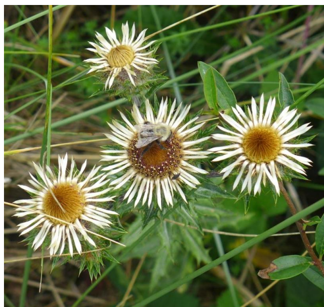
Driedistel - augustus 2013 - Noordwijkse Golfclub

Website Ministerie van Economische Zaken