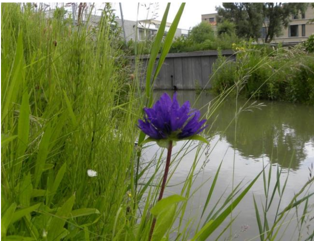
Kluwenklokje - juni 2009 - Middengebied Noordwijk