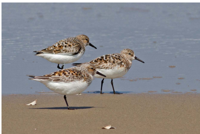
Drieteenstrandlopers in zomerkleed

Half juli is de periode waarin ongemerkt de Gierzwaluwen uit het dorp verdwijnen. Bijna net zo ongemerkt arriveren dan de eerste Drieteenstrandlopers alweer vanuit hun broedgebieden in Groenland en Siberië. Onze logo vogel is maar een heel korte periode afwezig uit Noordwijk. Half mei piekt de voorjaars trek. In sommige jaren loopt het staartje daarvan tot de eerste week van juni. Tijdens de jubileumlezing over de Drieteenstrandloper hebben we geleerd dat de late doortrekkers waarschijnlijk vogels uit West-Afrika zijn, die er lang over doen om voldoende vet op te bouwen voor de lange (waarschijnlijk non-stop) vlucht. Na de eerste week van juni is het uitzonderlijk nog een Drieteenstrandloper op het strand te vinden. In de afgelopen 50 jaar zijn er na de eerste week