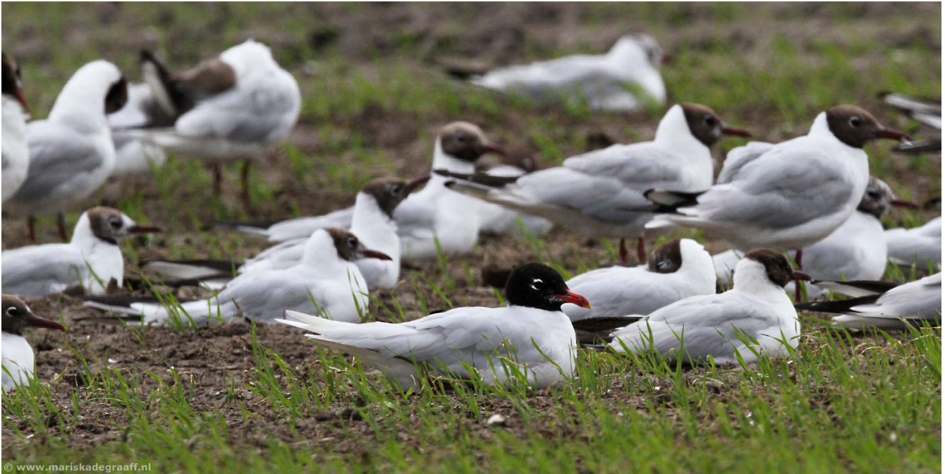
Zwartkopmeeuw -(adult zomerkleed) 16 juli 2016 Voorhout - Elsgeesterpolder

De maand juli startte wisselvallig en koel. Vooral in de eerste dagen van de maand en rond de 12° vielen er buien. Vanaf het midden van de maand liep de temperatuur op en werd het zomers warm. De wind bleef wel meest in de west tot zuidwesthoek met een paar dagen met oostenwind in de tweede helft van de maand.