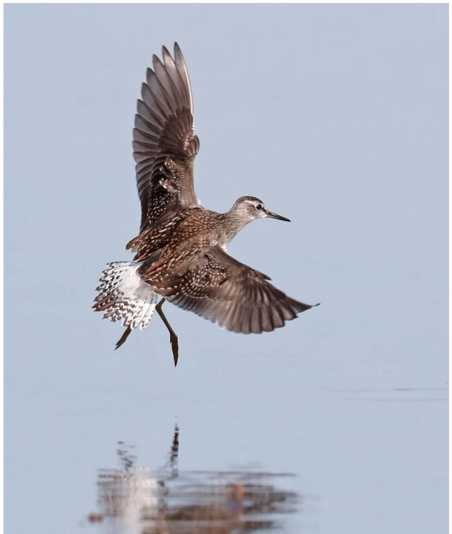
Bosruiter – 16 Augustus 2016 Noordwijkerhout - Zilkerpolder

Langs de zeetrek vloog op 5 augustus een juveniele Drieteenmeeuw en op 6 augustus een Kluut (JD). Op 15 augustus was een Kleine Zilverreiger aan het vissen in de Binnenwatering (AM). Er stonden in deze maand meerdere bollenvelden onder water, maar alleen het perceel in de Zilkerpolder trok bijzondere eenden en steltlopers aan. Op 16 augustus streek er een Bosruiter neer (RR). Op 21 augustus waren 3 Zomertalingen aanwezig in een groep van 96 Wintertalingen (MD). Op 27 augustus liepen er een Kleine Strandloper , een Krombekstrandloper , 2 Bonte Strandlopers en een Zwarte Ruiter (MD). Die dag vloog er ook een Kleine Strandloper op vanuit de Binnenwatering (RR). Net als vorig jaar verbleef er weer een Morinelplevier enige tijd in ons waarnemingsgebied. Een juveniele vogel was