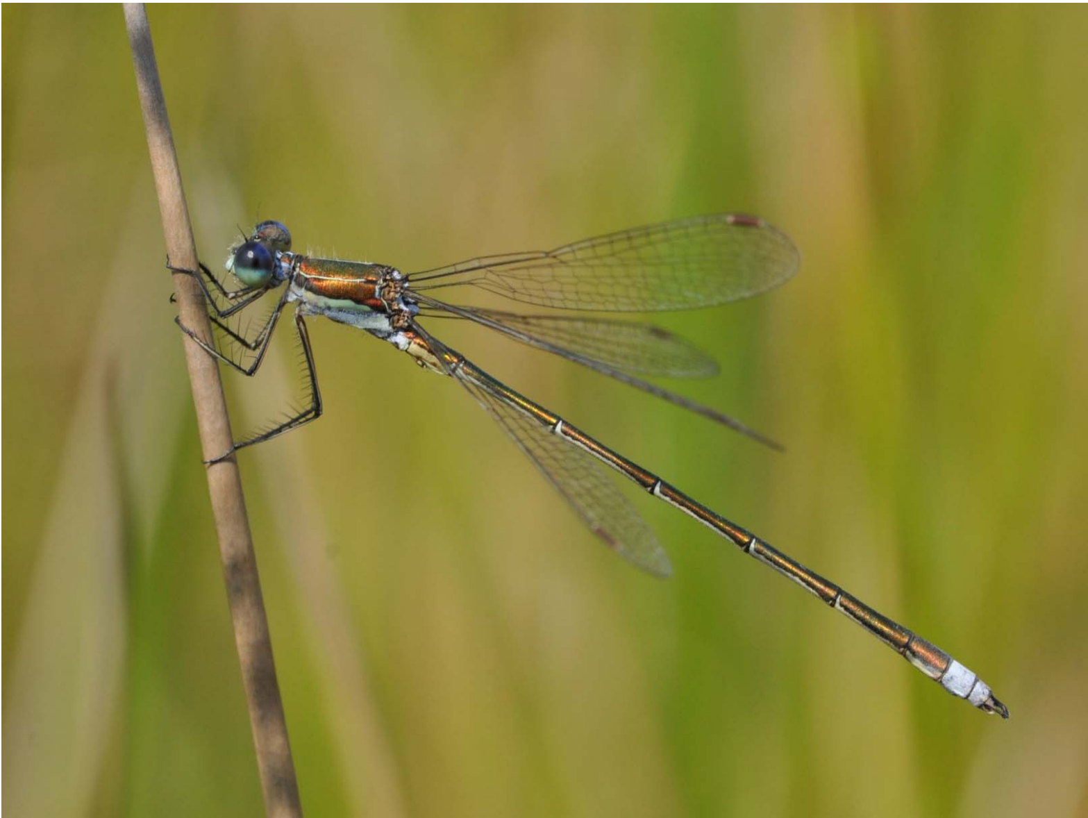
Tengere pantserjuffer – 31 augustus 2016 Noordwijk - Coepelduynen - Guytendel

liep een Purperreiger in Polder Hoogeweg (EH). Op 25 augustus zat er een Kleine Bonte Specht op Willem v.d. Bergh (PD). Op 27 augustus verscheen alweer de eerste grote Zilverreiger in de Zilkerpolder (HB).