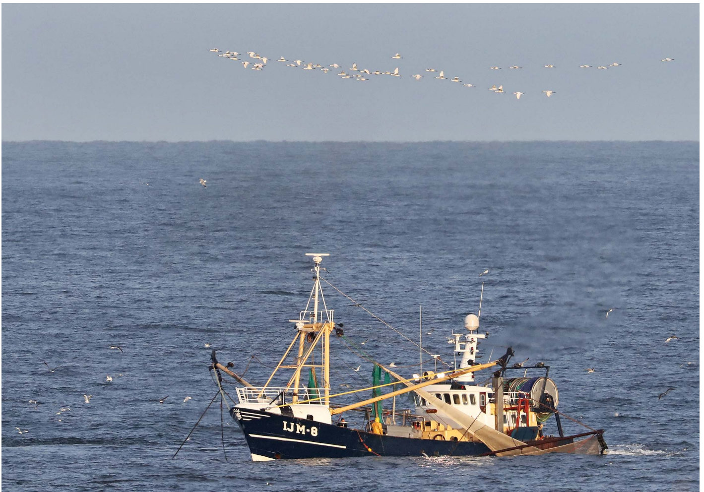
Lepelaars – 26 september 2016 Katwijk aan Zee - © René van Rossum

Op 7 september zat er een late Koekoek in de Elsgeestepolder (MD) en vloog er een Ortolaan over de Duindamseslag en 's nachts twee over Noordwijkerhout (MW). Langs de zeetrekhut vloog op 7 september de eerste Roodkeelduiker van het seizoen (JD). De mogelijkheden om stormgasten te zien waren vrijwel beperkt tot twee middagen waarop de wind even aantrok. Op 4 september passeerden in de middag 3 Grauwe en een Noordse Pijlstormvogel , waarbij de laatste een tijdje ter plaatse bleef (CZ). Op 28 september bracht de harde zuidwestenwind in de middag een mooie passage van zeevogels op gang met in totaal 55 Grauwe Pijlstormvogels , een Vaal Stormvogeltje , 4 Grote , 2 Middelste en 4 Kleine Jagers en een Parelduiker (HS JD RS). Op 29 september volgden nog 3 Grauwe Pijlstormvogels (JD). Jagers waren verder vrijwel afwezig en ook de aantallen sterns waren ook dit seizoen weer opvallend laag. De enige waarneming van een Vale Pijlstormvogel was op 17 september vanaf de Puinhoop (NA RR). Met de aanhoudende gunstige weersomstandigheden voor trekvogels waren de aantallen op de Puinhoop relatief laag, met af en toe een bijzondere soort. In totaal vlogen er 4 Grote Piepers , 4 Duinpiepers en 7 IJsgorzen langs (RR). Op 7 september kwam er een Morinelplevier (RR) over, op 9 september 2 Purperreigers (FD) en op 14 september een Reuzenster (RR).