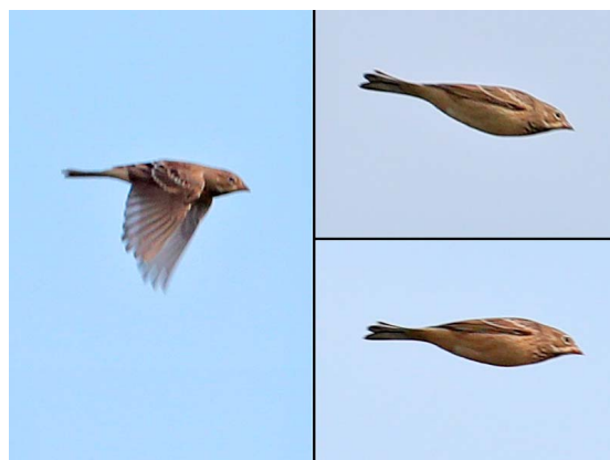
Ortolaan – 16 augustus 2016 Noordwijkerhout – Zilkerpolder

Op 1 en 15 augustus was er een Hermelijn te zien in de Elsgeestepolder (JD RG). Op 14 augustus vloog een Zuidelijke Keizerlibel in het Langeveld (EB). Een leuke vondst was de pioniersoort Tengere Pantserjuffer in de Guytedel op 31 augustus (CZ). Hier waren ook 3 Zwervende Pantserjuffers aanwezig (CZ LK).