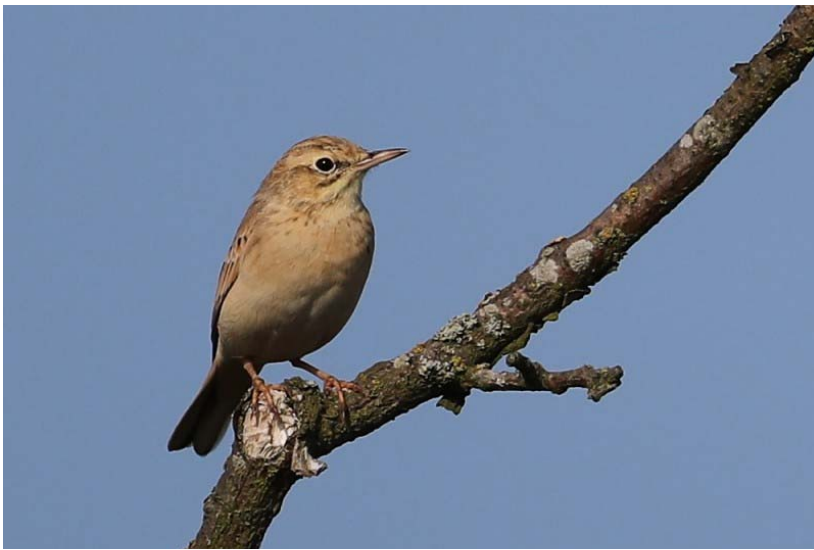
Duinpieper – 27 aug. 2016 AWduinen - De Wouwen

In de eerste helft van augustus zaten we in westelijke tot noordelijke stroming, met bewolkt en wisselvallig weer. Daarna werd het met een hogedrukgebied boven de Noordzee rustig weer met oostenwind. Rond de 20° werd het zomerweer nog verstoord door een depressie. De maand eindigde met hoge temperaturen en een oostelijke stroming.