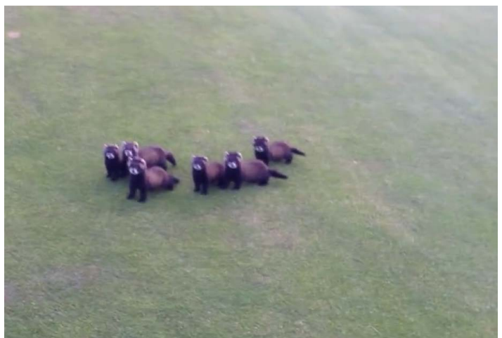
Bunzings-terrein Golfclub; still uit YouTube filmpje ©Gertjan Fleuren

Op 25 juli liep een familie van 6 Bunzings over het terrein van Golfclub Noordwijk (JD). Op 9 juli vloog een Eikenpage in de AWD Paardenkerkhof (RD)