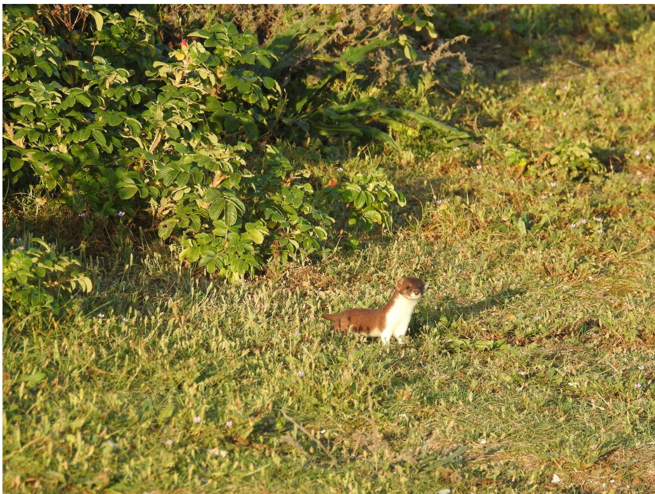
Wezel – 14 september 2016 Katwijk aan Zee - De Puinhoop

Bij de Puinhoop dook op 20 september een Sperwergrasmus op (RR). De Bladkoning hield het hoge niveau van vorig jaar vast, met de eerste op 20 september bij De Blink (RB) waarna er vanaf 25 september vrijwel dagelijks één werd ontdekt in ons waarnemingsgebied (CZ RG e.a.).