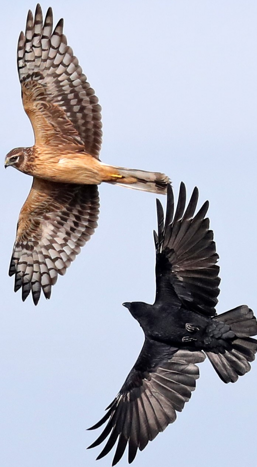
Blauwe Kiekendief en Zwarte Kraai - 8 okt.2016- Katwijk aan Zee - De Puinhoop