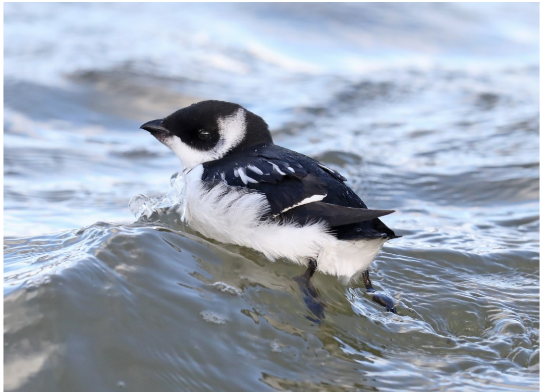
Kleine Alk -2 nov.2016-Buitenwatering Katwijk

Op 16 november vloog de laatste vlinder van het seizoen: een Dagpauwoog aan de Achterweg, op de locatie van de Dwerggorzen (TW).