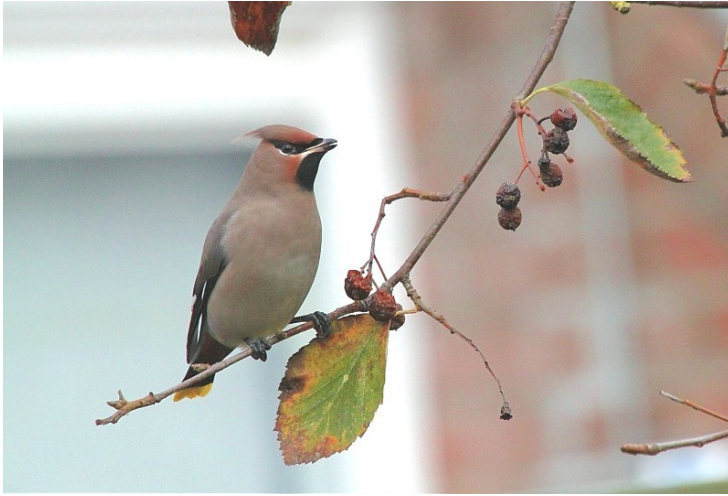
Pestvogel-8 nov. 2016-Katwijk aan Zee – Rijnsoever

November was relatief koud. Eerst bracht een westelijke stroming regen, waarin de wind op sommige dagen aantrok tot windkracht 5. Daarna bracht de noorden- tot oostenwind kou en de eerste nachtvorst. Rond de 15 e trok de wind weer naar west en werd het nat. De enige herfststorm van het seizoen was op 20 november, met wind uit het zuidwesten.