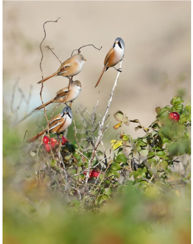
Baardmannen-de Puinhoop Katwijk