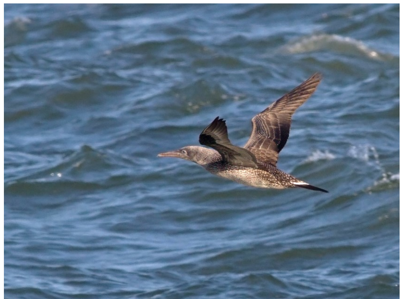
Jan van Gent 1 ste jaars

Een Jan-van-Gent, die vlak achter de branding door het beeld scheert, maakt elke ochtend zeetrekten geslaagd. Als vogel van volle zee heeft hij de kust niet nodig, dus het is een buitenkans om ze van dichtbij te zien. Tweede Kerstdag was zo'n bijzondere dag in de zeetrekhut met een continue stroom van kleine groepjes genten, die vlakbij langs kwamen. Dat betekende ook een nieuw december record voor de telpost. In 4 uur tijd telden de zeetrekters 496 vogels, met een nieuw december uurrecord van 190 vogels. Ook elders langs de kust was het een spectaculaire dag. De telpost Ouddorp vestigde het record voor de beste decemberdag voor Jan-van-Gent ooit met 3514 vogels. Van de wereldpopulatie Jan-van-Genten broedt zo'n 60% op de Britse Eilanden. Waarschijnlijk zien we hier in de herfst dus vooral Britse vogels, die na het broedseizoen uitzwermen over de Noordzee en de Atlantische Oceaan. De meeste trekken naar het zuiden weg en overwinteren van de Middellandse Zee tot de evenaar. Tot tien jaar geleden zagen we in de winter meestal maar enkele individuele Jan-van-Genten. In de eerste jaren van het zeetrek kijken, was het zelfs een zeldzaamheid, met een totaal van 11 vogels waargenomen over de periode 1972-1990. In de jaren vanaf 2008 werden dat er