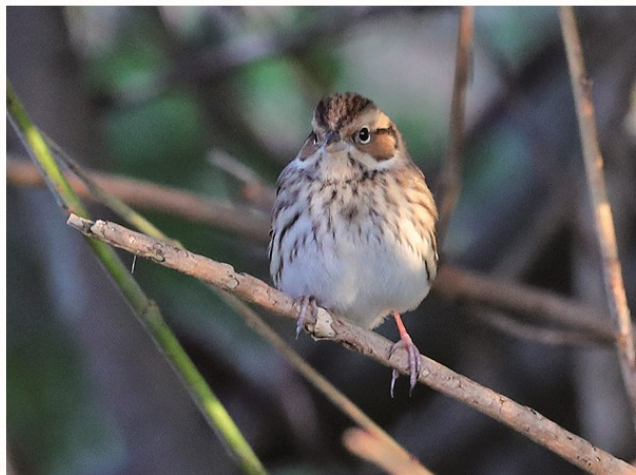
Dwerggors-4 luik