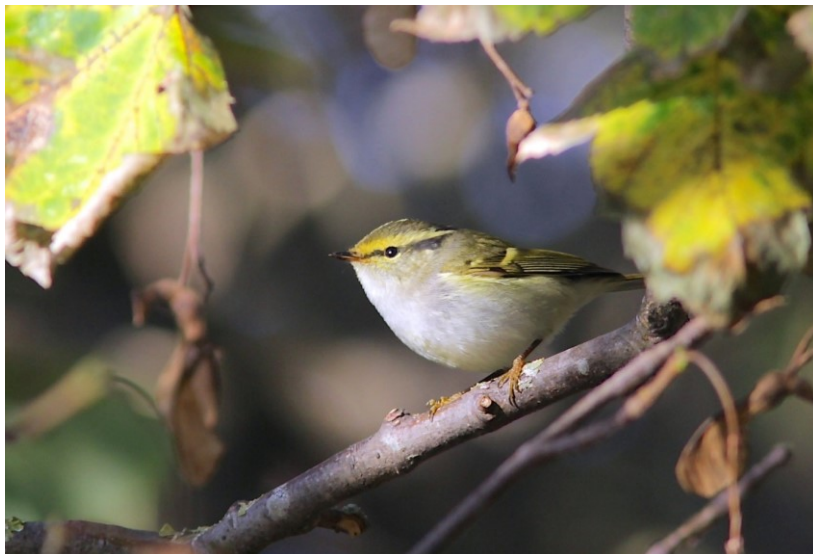
Pallas' Boscanger-31 okt. 2016 Noordwijk - Noordduinen - Duindamse Slag

met een groepje mezen en Tjiftjaffen in de AWD Haasvelderduinen (ML). Op 27 oktober zat er één in de Blink (MW). Niet ver daar vandaan langs de Noraweg zat op 31 oktober een Pallas Boscanger (MW). Op 29 oktober dook een Taigaboomkruiper op in het terrein van Willem v.d. Bergh (MD). De eerste tekenen dat er Pestvogels in aantocht waren, kwamen op 26 oktober (MD) en 30 oktober (MW) met een eerste overvliegende vogel over Rijnsoever en Noordwijkerhout.