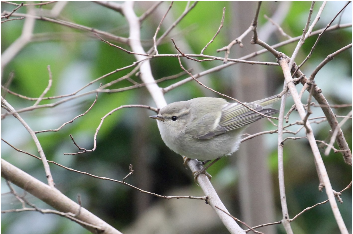
Humes-Bladkoning-31 dec 2016-Noordwijkerhout

Op 8 december liep er een Wezel in de Noordduinen bij de Driehoek (JHa)