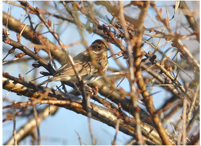
Dwerggors-12 dec. 2016 Noordwijk - Middengebied zuid