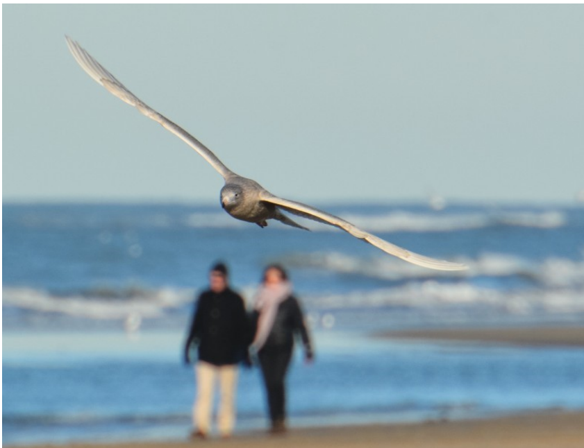
Grote Burgemeester 16 januari 2017 Katwijk aan Zee

foto's en de individuen die daar op te onderscheiden zijn, hebben minimaal 11 vogels de stranden tussen de Katwijkse Uitwatering en de provinciegrens bezocht. De eerste landde 8 januari op het strand bij Nora. Vooral op het strand tussen Katwijk en Noordwijk waren ze vervolgens goed te vinden. Op 14 januari zaten hier zelfs drie vogels bij elkaar. Mogelijk waren het er meer: op de foto's van die dag zijn zelfs 5-6 verschillende vogels te onderscheiden. Vrijwel alle Grote Burgemeesters die onze stranden bereikten, waren tweede kalenderjaar vogels. Op het strand van Nora bivakkeerde van 22 januari t/m 2 februari ook een derde kalenderjaar vogel. Een andere derde kalenderjaar, eerder gefotografeerd in IJmuiden, was even aanwezig op 5 maart. Bij de Kleine Burgemeester ging het om minimaal 4 verschillende vogels. Ook bij deze was de eerste waarneming van het strand bij Nora. Van 14 t/m 17 februari zaten twee Kleine Burgemeesters op het strand voor de Coepelduynen. Vanaf 3 februari verscheen daar een andere, lichte vogel die de hele maand februari en maart bleef.