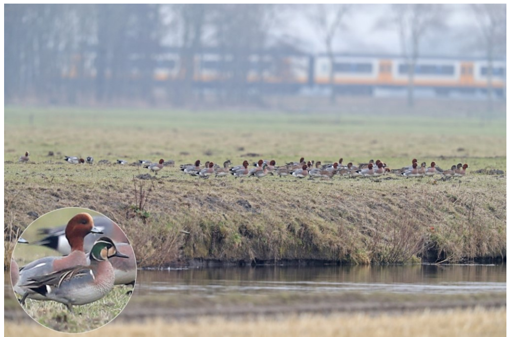
Siberische Taling 5 februari 2017 Polder Hoogeweg

van de Lena rivier, binnen het verspreidingsgebied van de Siberische Taling. De soort stond tot voor kort te boek als bedreigd. Ooit de meest algemene eend in Oost-Azië, waren er begin jaren tachtig nog maar 20-40.000 over. Jacht was een belangrijke oorzaak. Zo schoten drie Japanners in 1947 in 20 dagen tijd 50.000 Siberische Talingen. Gelukkig gaat het recent weer goed met de soort. Met name in Zuid-Korea verschijnen tijdens de winter weer grote aantallen, zelfs meer dan 1 miljoen in 2009. En één bereikte Noordwijk. Deze had een afstand van minimaal 5000 km afgelegd. Dit is pas de 13 e keer dat de Siberische Taling in Nederland is gezien en de eerste keer voor Noordwijk. De vogel was een eerstejaars man en een prachtige eend om te zien. Je denkt dat je hem er zo uitpikt tussen de andere eenden in de polder. Dit bleek in de praktijk tegen te vallen. Zat hij eerst nog regelmatig redelijk zichtbaar bij de Noordwijkerhoek, later hield hij zich diep in de polder op. Hier bleef hij tot in elk geval het einde van de maand. In de kleine slootjes was hij meestal niet te zien. Er zat voor de vogelaars niets anders op dan te wachten tot hij de kant op kwam om samen met de Smienten te grazen in het weiland. Hij had er zo weken onopgemerkt kunnen zitten!