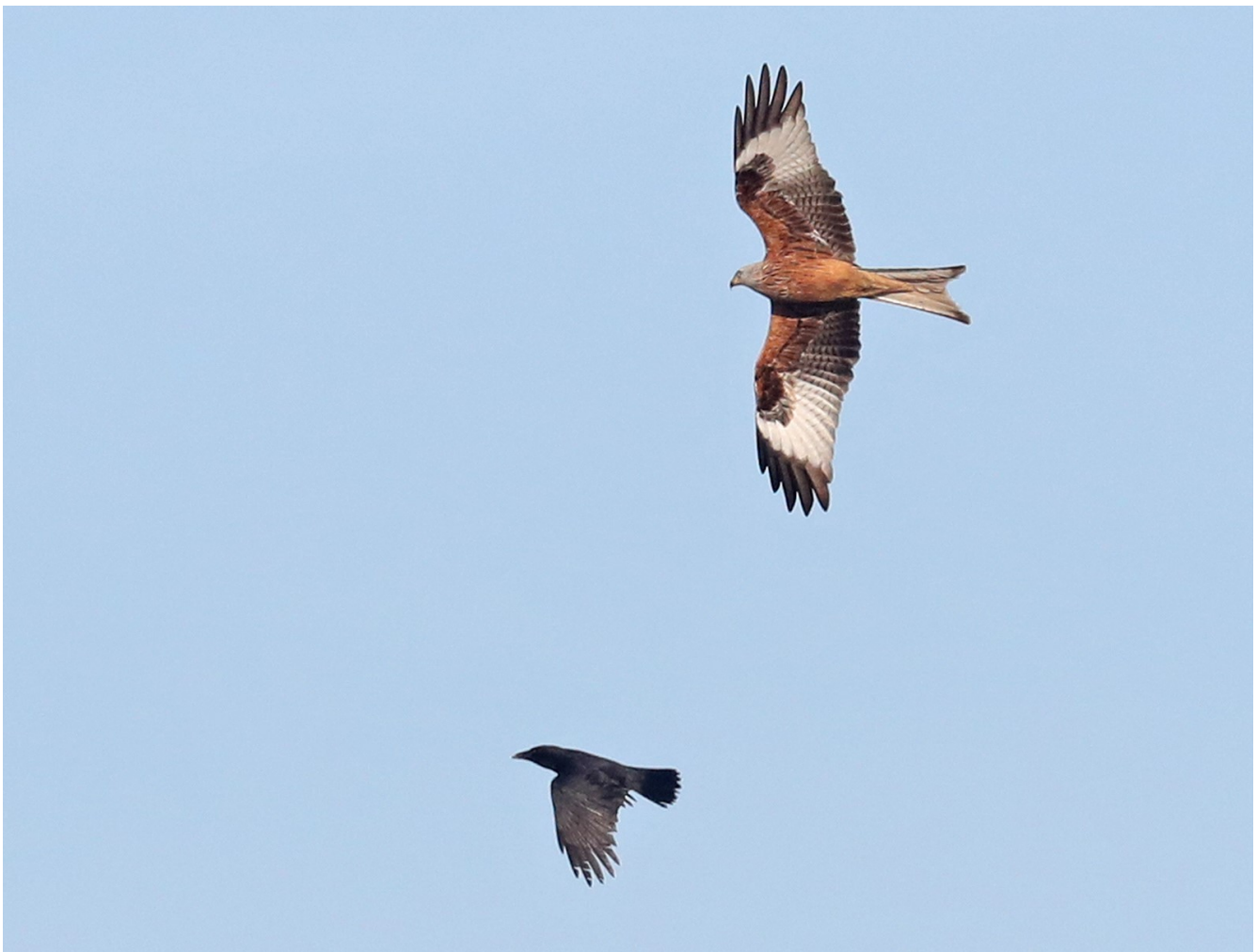
Rode Wouw en Zwarte Kraai 27-03-2017 Berkheide Katwijk