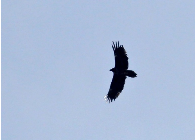
Lammergier 12 maart 2017 Katwijk

Gaat daar nou een Zeearend? Ja, geweldig! Reinder Genuit en ik waren erg blij met deze verrassing boven ons hoofd toen we op 12 maart een bezoekje brachten aan de plek van de Dwerggorzen. Maar wacht die andere, wat is dat? Het duurde even voordat het doordrong dat we niet alleen een Zeearend, maar ook een Lammergier in beeld hadden! De vogels vloog naar zuid, richting Katwijk, recht op één van de grootste concentraties vogelaars van Nederland af. Dat was dus snel bellen en de app groepen inzien. Een paar wisten hem gelukkig op te pikken. De gelijktijdige verschijning van de Zeearend, die een westelijker koers over Katwijk aanhield gaf wel veel verwarring. Daarna kon de vogel over Rijswijk, Delft tot aan Rotterdam gevolgd worden. De volgende ochtend trok het spoor verder richting het zuidoosten en was de vogel tot in Noord-Brabant te volgen.