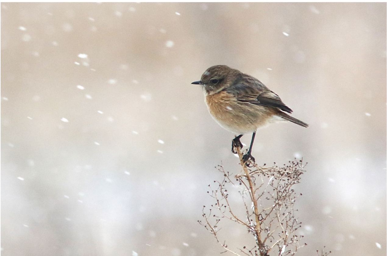
Roodborsttapuit 11-02-2017 Voorhout - Elsgeesterpolder