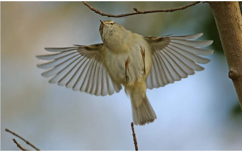
Humes Bladkoning – 6 januari 2017 Noordwijkerhout

Zelden deden tegelijkertijd zoveel zeldzaamheden Noordwijk aan als in dit kwartaal. Terugbladerend naar dezelfde periode vorig jaar was de hoofdrol toen weggelegd voor een Zeearend. Daar vloog er nu ook één van over, maar meer dan een bijrol zat er nu niet in. Een veel grotere rol hadden de langblijvers. De twee Dwerggorzen van de Achterweg en de Humes Bladkoning van Noordwijkerhout zaten er nog in het nieuwe jaar en trokken veel vogelaars naar Noordwijk. In totaal voerden 748 vogelaars dit kwartaal een waarneming in voor het Noordwijkse gebied. Van hen zagen 457 de Dwerggorzen. Vanaf 4 februari kwam er nog een extra reden bij om Noordwijk te bezoeken. Maarten Wielstra ontdekte een Siberische Taling in de Zwetterpolder. Dit was de echte hoofdrolspeler en de teller van het aantal vogelaars, die dit eindje hadden gezien, stond eind maart op 465.