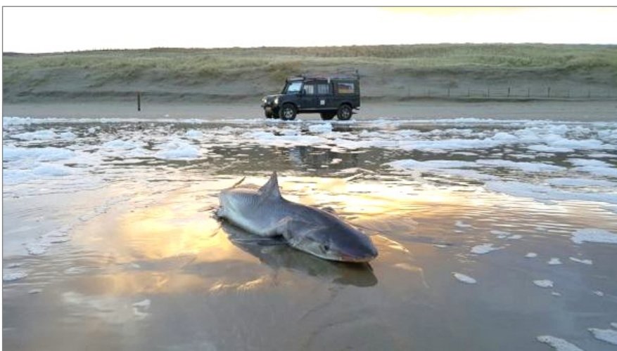
Ruwe Haai 14-03-2017 Strand Langevelderslag