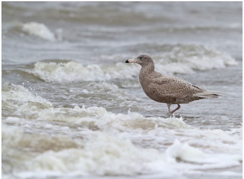
Grote Burgemeester 13 januari 2017 Katwijk aan Zee – strand

Alsof het nog niet genoeg was, kwam er dit kwartaal ook een niet eerder vertoonde influx van Grote en Kleine Burgemeesters op gang. De noordwesterstorm van 4 januari had overwinterraars vanaf de noordelijke Noordzee een duwtje in de rug gegeven en hen op de Nederlandse stranden doen belanden. Daar vonden ze een rijk gedekte tafel. De storm had opnieuw schelpdieren losgewoeld en het strand lag vol met zwaardschede en zeesterren. Van 11 tot 13 januari was er, dankzij harde westenwind, opnieuw een grote aanvoer. Duizenden meeuwen deden zich hier aan te goet, waaronder een aantal Grote en Kleine Burgemeesters. De Grote waren in de meerderheid. Op basis van de