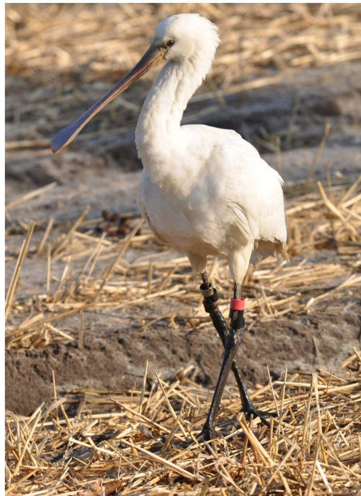
Lepelaar 22-01-2017 Noordwijk