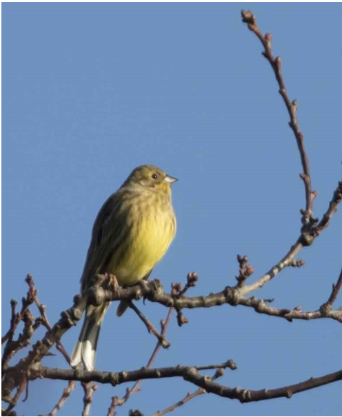
Geelgors 5-1-2017 Polder Hoogeweg

Na een serie van zachte januarimaanden was deze maand weer vrij koud. De westelijke stroming van de eerste twee weken leverde een noordwesterstorm op 4 januari, gevolgd door een westerstorm van 11 tot 14 januari. De laatste bracht ook veel neerslag in een verder vrij droge maand. De tweede helft van de maand ging de wind meer naar het oosten en was het rustig winterweer.