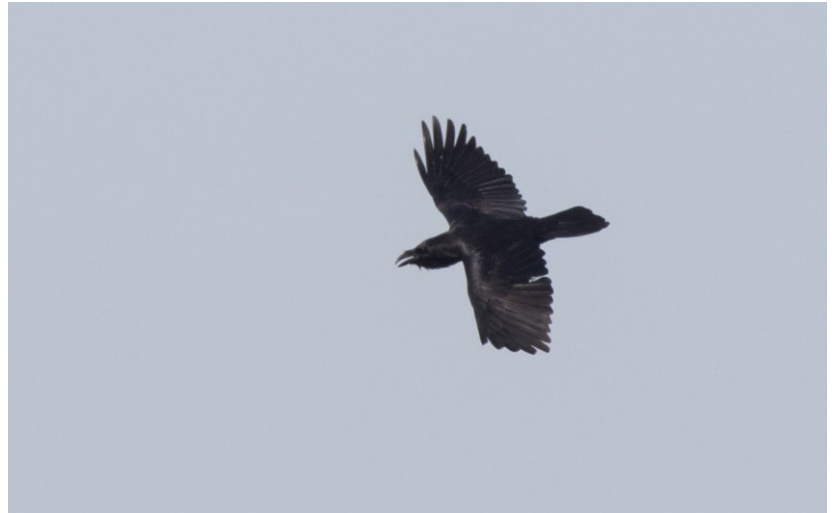
Raaf 14-03-2017 AW-duinen - Starrenbroek