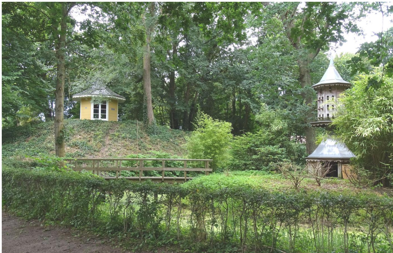
De theekeupel en de duiventil op Calorama. In de duiventil broedden in 1967 nog drie paartjes Spreeuwen.

In de zeventiende eeuw lag er een kruidenkwekerij op de plek van het huidige Calorama. De grond werd hiervoor geëgaliseerd en het overgebleven zand als hoge wallen rond de kruidentuinen gelegd ter bescherming tegen de zeewind. Enkele van deze wallen liggen er nog steeds en zijn begroeid met loofhout, vooral populieren en esdoorns. Er resteren nog twee oude kruidentuinen, waarvan een als rozentuin. Een derde open veld met in het midden een rode beuk heeft een boeiende Noordwijkse historie. Het wordt 'het Martelveld' genoemd. Hier zou de monnik Jeroen in de Negende Eeuw zijn onthoofd door de Noormannen. De woning van de kruidenkweker vormt de kern van het huidige landhuis, dat er in de eerste helft van Negentiende Eeuw omheen gebouwd is. Ook een kruidenschuur uit de begintijd, die de Rozemarijnschuur wordt genoemd, staat er nog steeds. Met een theekeupel, een duiventil en een koetshuis is Calorama een verrassend compleet en zeer goed bewaard landgoed. Water is er in de vorm van twee vijvertjes, een voor het huis en de ander rondom de duiventil. Rond het huis staat een aantal oude beuken, eiken, lindes en kastanjes. Op enkele plekken is een dichte onderbegroeiing aanwezig. Een voormalig bollenperceeltje aan de noordzijde tegen de RK-begraafplaats is nu een grasveld, omzoomd door jonge Ginkgo's. Een grote variatie dus op een klein stukje grond.