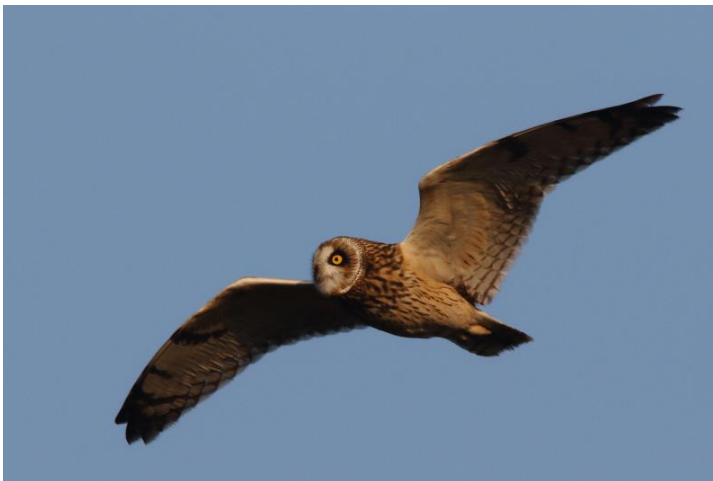
Velduil 24-9-2017 Coepelduynen

Roerdomp op 15 en 22 augustus (MW). In de Coepelduynen verschenen aan het eind van de maand zeldzame doortrekkers: een Hop op 20 augustus (GB), een Draaihals op 23 augustus (RR ea), een Velduil op 23 augustus (RR ea) en een Sperwergrasmus op 26 augustus (RR ea). Op 28 augustus zaten er 6 Paapjes in de Elgeesterpolder (MD). De laatste Gierzwaluw vloog op 13 augustus boven de Grashoek (RM). Op 14 augustus hadden zich 32 Grote Lijsters verzameld in de Haasvelderduinen in de AWD (ML).