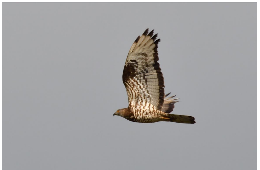
Wespendief 9-08-2017 AWD

Eerder in de maand dook in de geluidsopnamen op 13 augustus een Woudaap op, gevolgd door een