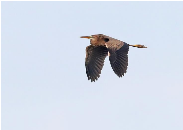
Purperreiger 14-08-2017 Katwijk - De Puinhoop

De maand augustus was koel en wisselvallig. De wind zat vooral in de westhoek en trok een aantal keer aan naar windkracht 5 of 6. Pas in de laatste week keerde het zomerweer even terug. In het midden van de maand en rond de 23 e was er een aantal dagen dat de wind in de zuidoosthoek zat en de trekomstandigheden goed waren.