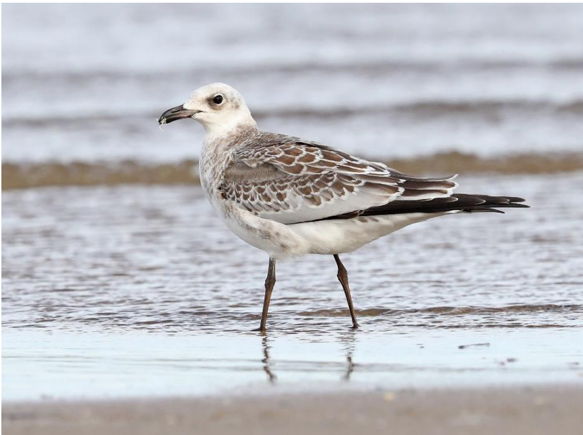
1e kalenderjaar Zwartkopmeeuw Buitenwatering Katwijk 2-08-2017

In de maand juli was het wisselvallig zomerweer. In de eerste tien dagen liep de temperatuur flink op. De zomerse warmte werd ook weer afgestraft met onweersbuien. Daarna volgde koel en wisselvallig weer. Na weer een warmere periode bracht de tweede helft van de maand opnieuw weer regen en wind, onder invloed van een lagedrukgebied boven de Britse eilanden.