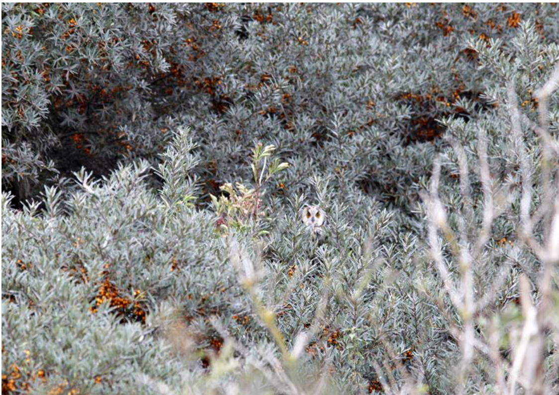
Ransuil – 16-09-2017 Coepelduynen