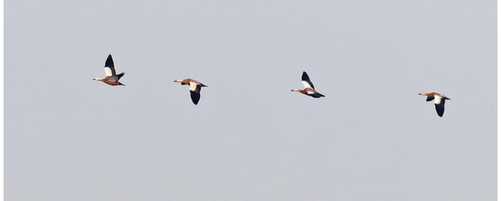
Casarca's 23-08-2017 de Puinhoop Katwijk