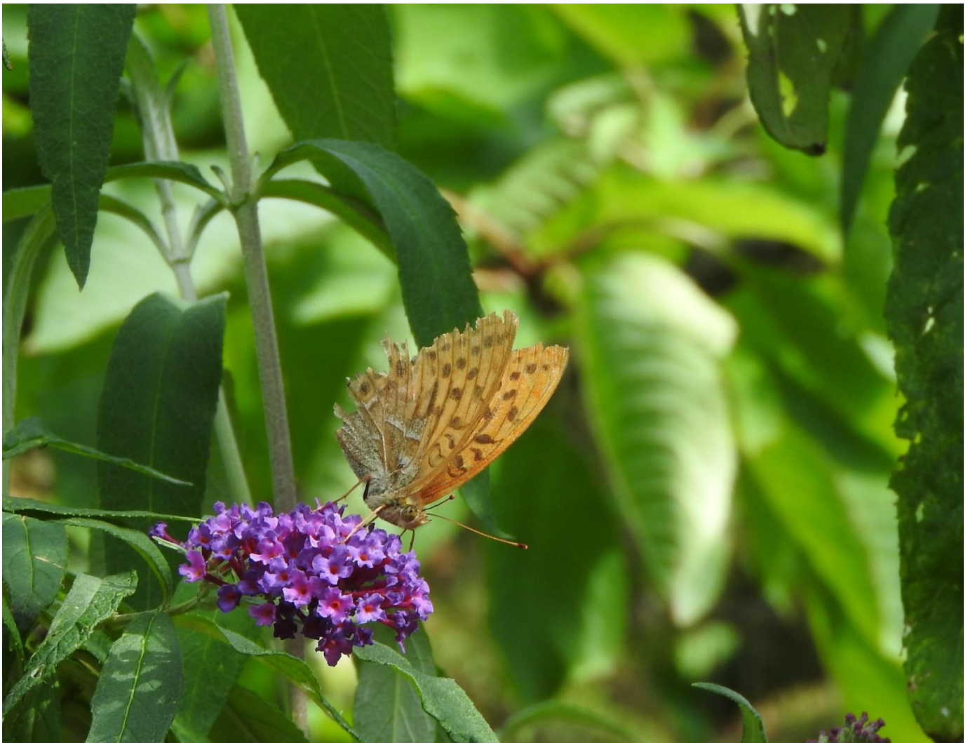
Keizersmantel 29-08-2017 Duinpark Noordwijk