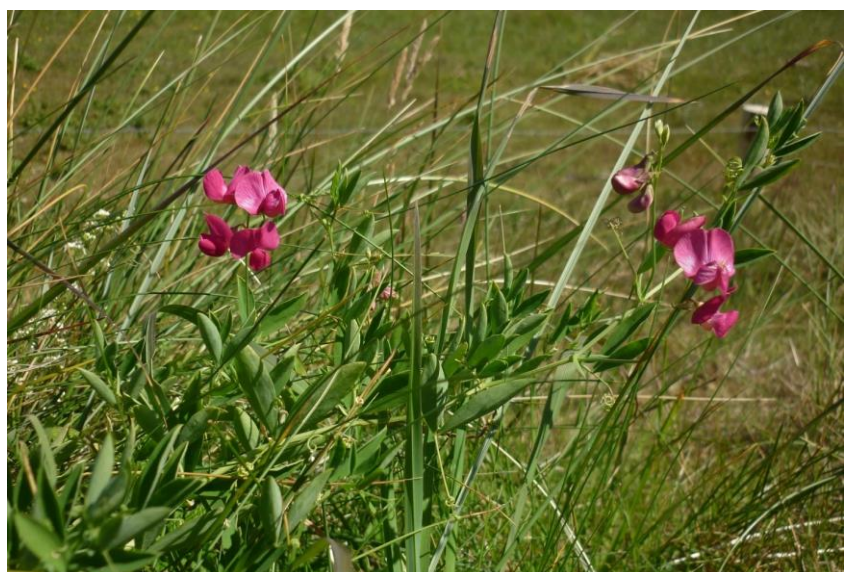
Aardaker juli 2015 Noravallei

Na de inleiding waarin de biodiversiteit per landschapstype wordt aangestipt, volgt een