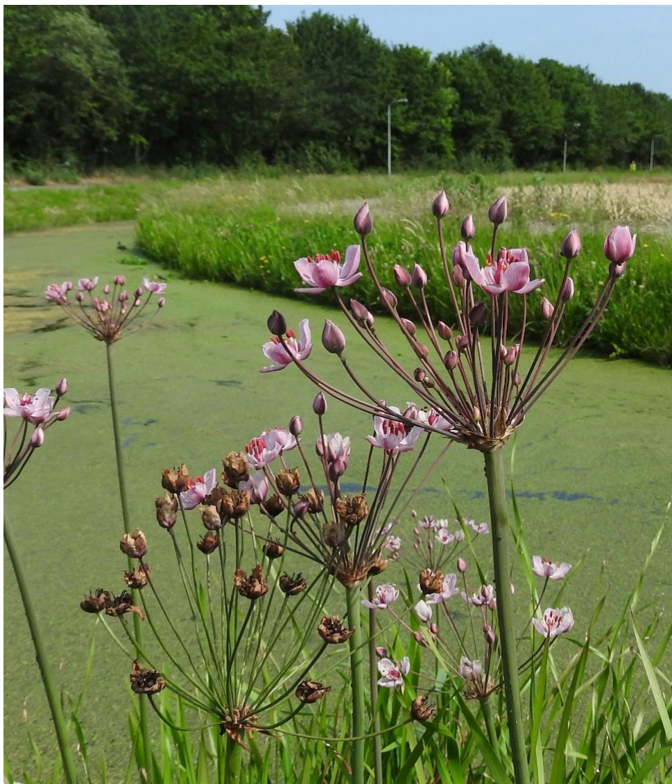
Zwanenbloem juni 2017 Leeweg, Noordwijk

Leden die het boek thuisbezorgd willen hebben, kunnen het boek nu reeds bestellen voor €21,50 (inclusief verzendkosten) door overmaking van genoemd bedrag op bankrekeningnummer NL39INGB0002573795 ten name van Vereniging voor Natuur- en Vogelbescherming Noordwijk, met vermelding van FLORA en naam en adres. Na de presentatie zal het boek dan zo spoedig mogelijk verstuurd worden.