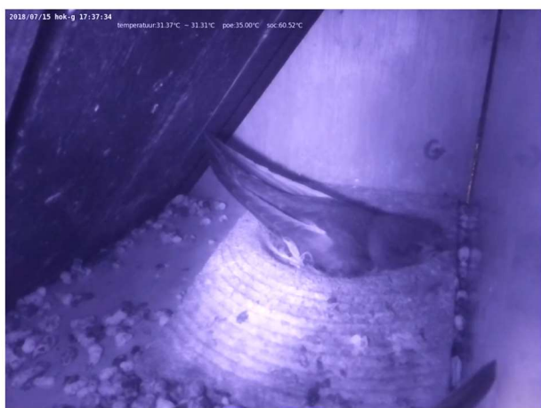
Gierzwaluw, Common swift 'Apus apus' Live Nest Noordwijk

Al bijna twintig jaar broeden ieder jaar één of twee paar Gierzwaluwen in onze schuur aan de Douzastraat. Het broedproces wordt zo veel mogelijk gevolgd en vastgelegd in een dagboek. De eerste jaren gebeurde dit door in de nestkasten te kijken. Aan de binnenzijde van deze kasten zit een glazen wandje. Je kunt de vogels tot op tien centimeter benaderen, zonder ze te verstoren. Nadeel van dit systeem is dat het relatief donker is in de kastjes, waardoor je niet alles even goed kunt zien. Het voordeel is dat je zowel de nestplek zelf als de nestingang in de gaten kunt houden. In 2010 werden infraroodcamera's geïnstalleerd in de bewoonde kastjes. Hierdoor is alles veel duidelijker te zien, zowel overdag als 's nachts. De camera's staan gericht op de nestplek, de nestingang blijft buiten beeld.