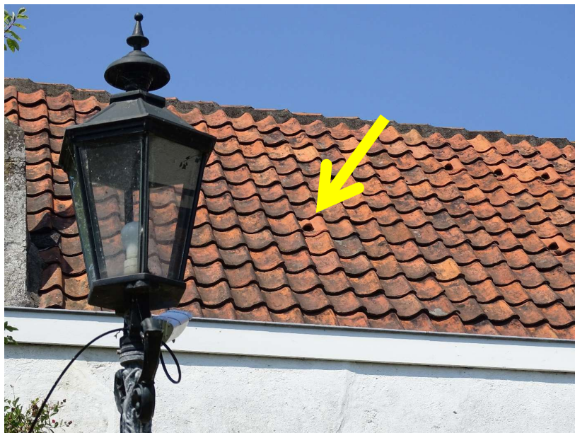
Schuur in de Douzastraat. Links de tuinlamp en bij de pijl de nestingang van de Gierzwaluwen in kastje G

Binnen zit de oudervogel nog steeds in de nestkom. Jonge Gierzwaluwen moeten het dus helemaal zelf volbrengen. Dat is toch wat anders dan met je eigen kinderen. Wekenlang help en bescherm je ze op weg naar hun eerste vrije stapje van de stoelpoot naar de tafel..... Ik voel me een bofkont dat ik het uitvliegen nu eens helemaal heb kunnen volgen. En alle drie de jongen op dezelfde avond in precies één uur tijd.