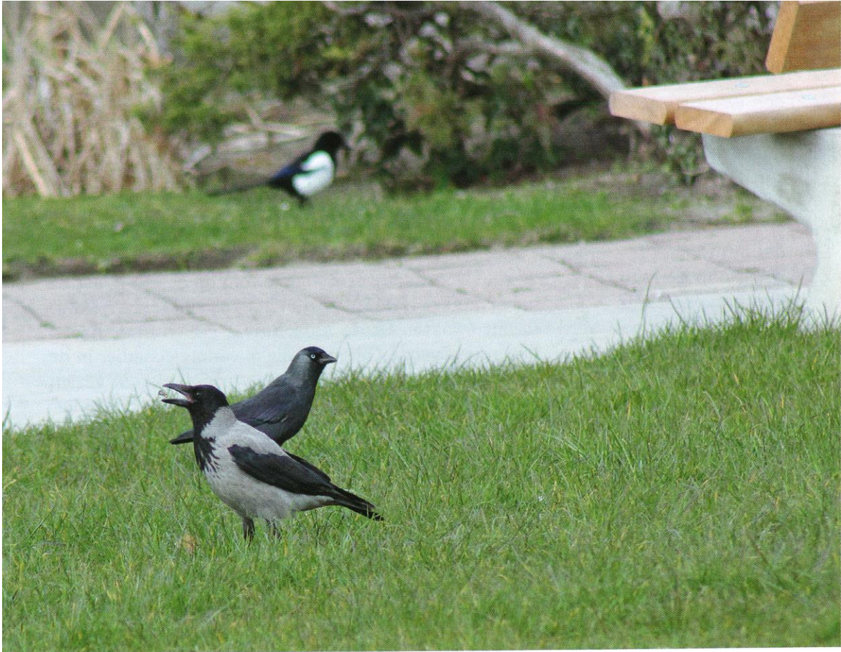
BONTE KRAAI