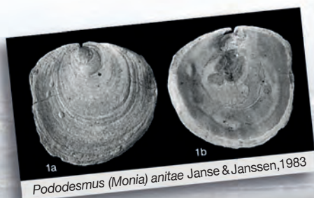
Pododesmus (Monia) anitae Janse & Janssen, 1983