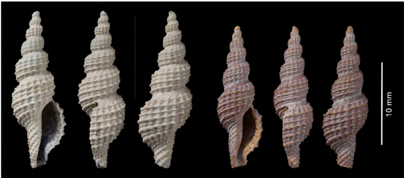
Raphitoma antonjanssei Marquet, 1998. Foto's door Ronald Pouwer in het kader van het strandfossielenproject.

Anton was een voortreffelijk wetenschapper. Hij heeft zich laten leiden door zijn nieuwsgierigheid en zich niet laten inperken door gemakkelijke 'idee fixen'. Steeds weer bleef hij kijken en argumenten verzamelen en afwegen. Het classificeren van verschillende fauna's op grond van samenstelling van soorten en fossilisatiekenmerken van strandsuppleties en het proberen te herleiden van die fauna's is een sterk onderbelicht succes geweest. Nog steeds zijn er kwartaire fauna elementen van onze kust waarvan we de exacte herkomst en context niet begrijpen. Anton waarschuwde ervoor dat de grote Cerastoderma edule forma major mogelijk niet uit dezelfde afzettingen komt als de koele Astarte borealis . Een waarschuwing van Anton betekent in zo'n geval opletten geblazen!