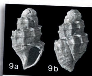
Babylonella stemerdinki Janse & Janssen, 1983