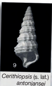
Cerithiopsis (s. lat.) antonjanssei