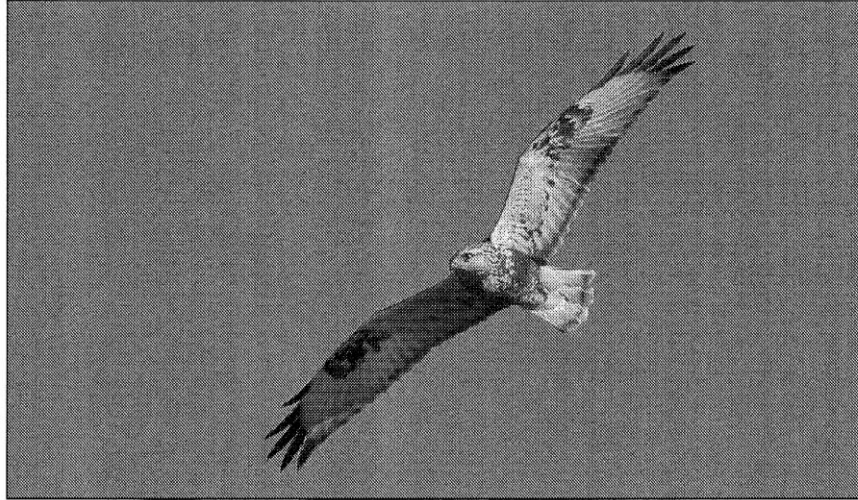
Ruigpootbuizerd in volle vlucht.

Maar er waren ook heel vervelende ervaringen. Als de dag van gisteren herinnert hij zich zijn verjaardag op 6 maart van vorig jaar. Die dag werd de komst van een heleboel Kraanvogels voorspeld. Bij krachtige oostelijke wind willen de Kraanvogels tijdens de trek richting het westen dwalen. Dus besloot Lars de dag door te brengen in het meest oostelijke deel van de regio, de Inlaagpolder bij Spaarnwoude. Hij heeft daar een hele dag rondgezworven; zonder enig resultaat. Toen hij thuisgekomen het internet raadpleegde, bleken er meerdere groepen Kraanvogels te zijn gesignaleerd boven de stad en zelfs exact boven zijn ouderlijk huis. Balen dus, want daarna heeft hij dat jaar geen Kraanvogel meer gezien. Zo ook bij de Roodhalsgans, die vorig jaar februari neerstreek in deze regio. Lars was net op vakantie en miste deze zeldzame soort. Daarom meent hij dat zijn record 'verbeterbaar' is. Maar dat moet een ander dan maar doen. Vooralsnog heeft hij weer een doel bereikt.