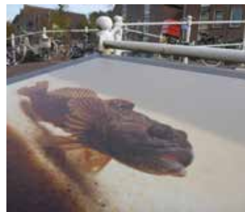
Rivierdonderpad Doutzen werd vervangen door Jack Sparrow.

De nieuwste ontwerpen voor meertalige informatiepanelen liggen op de tekentafel. Zo komt er een plaat die uitlegt wat een rivierdonderpaddenhotel is (zie elders in deze Schubben en Slijm). Ook zal een plaat aan toeristen uitleggen hoe je brutale meeuwen ontmoedigt en waar de dichtstbijzijnde glas-, papier- en restafvalcontainers zijn. Bezoekers worden zo op een plezierige wijze geïnformeerd over de soortenrijke Haven waaraan zij vakantie vieren. Met duidelijke afbeeldingen