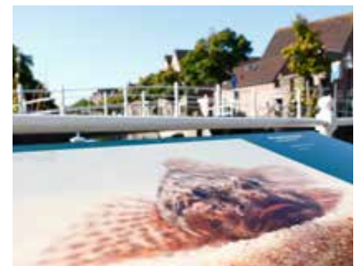
Buurtbewoner Thal: "Ik adopteert hem wel! Af en toe een kwastje erover, toch?"