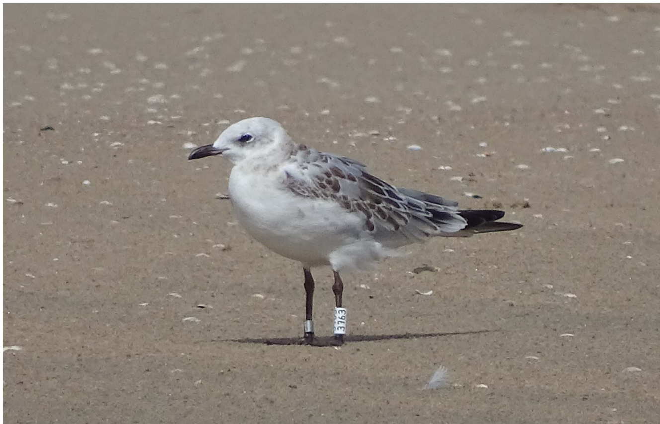
10 augustus 2018 Zwartkopmeeuw - (eerste kalenderjaar) Katwijk aan Zee - strand

Vanaf eind juni vliegen in de broedkolonies de jonge Zwartkopmeeuwen uit. Vanaf de tweede week van juli bereiken de uitzwermende jonge vogels de stranden van Noordwijk en zijn ze een vrijwel dagelijkse verschijning voor de zeetrekthut. Sinds ongeveer 2005 is dit een vast patroon geworden. Dit heeft waarschijnlijk te maken met de vestiging en uitbreiding van broedkolonies ten noorden van ons, rond het IJsselmeer (o.a. de Kinseldam, De Kreupel en Markerwadden) en in Duitsland (o.a. de Elbemonding). Dit jaar waren er uitzonderlijk veel jonge vogels. De eerste verscheen op 6 juli op onder water gezet bollenland (AM). Op 15 juli zat er voor het eerst een groepje van 3 op het strand van de Coepelduynen, vergezeld door een adult (PS). Van 27 juli tot 8 augustus verbleven er steeds meerdere vogels tegelijkertijd rond de Binnenwatering Katwijk en het strand van de Coepelduynen. Op 7 augustus zaten er zelfs 9 in totaal (AM). Een aantal Zwartkopmeeuwen droeg een kleurring. Een buitenkans om erachter te komen van waar deze vogels afkomstig zijn.