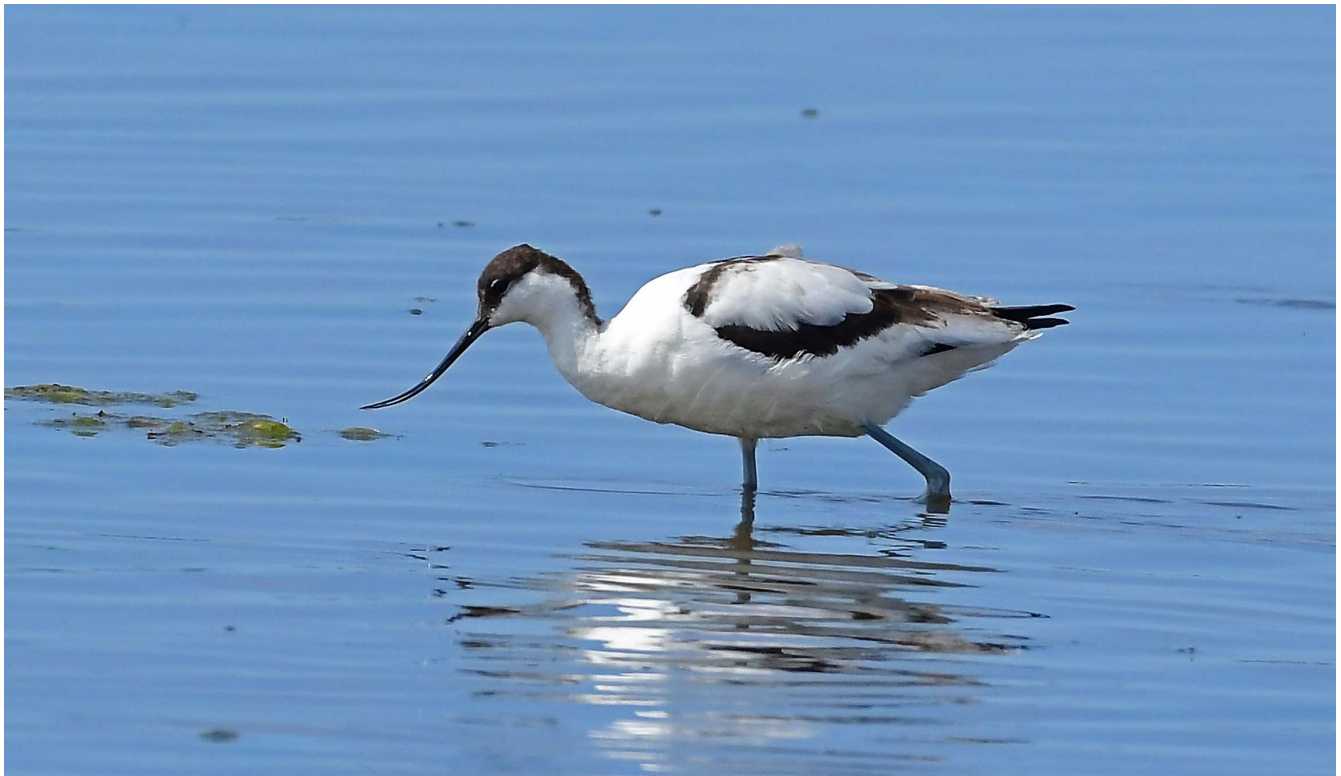
1 augustus 2018 Kluut - Voorhout - Elsgestepolder

Het grootste perceel lag in de Hogeveense Polder achter Sixenburg, met nog een tweede moeilijk toegankelijke locatie dieper in de polder. Deze stond al vanaf begin juni onder water en werd pas 16 september weer droog gezet. Dit was een perceel volgens de nieuwe methode. Het water was daardoor steeds relatief diep. Voor eenden bleek dit ideaal. Die zaten er met tientallen. De top was op 3 september toen er 300 Krakeenden, 200 Wilde Eenden, 250 Slobeenden en 3 Smienten op het perceel zaten (JB). Bij de steltlopers zetten vooral de soorten die met dieper water overweg kunnen de toon: maximaal 26 Grutto's en 11 Groenpootruiters. Maar ook Kemphanen waren vaste gast (maximaal 24 aanwezig) en er streken regelmatig Bosruiters neer. Op 14 juli zat er een Krombekstrandloper (JZ). Met de nieuwe waterbesparende methode blijken de percelen nog steeds in trek bij vogels. Met de plastic schotten eromheen ziet het er minder fraai uit en voor soorten als strandlopers hebben ze wat minder te bieden. Desondanks leveren ze toch mooie waarnemingen op en voegen wat unieke toe aan het vogels kijken in de Bollenstreek.