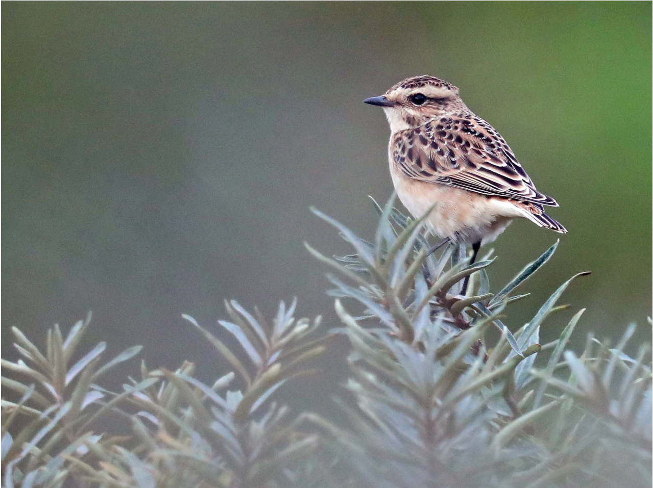
7 september 2018 Paapje - (eerste kalenderjaar) Noordwijk - Coepelduynen - Guytendel

De maand startte met rustig weer. Van 5 tot 7 september trok vanuit het zuidwesten een depressie met veel regen over. Daarna herstelde het rustige weer zich. De eerste herfststorm was op 21 en 22 september met harde wind uit zuidwest en west. Dit was een restant van de orkaan Florence die een week eerder in de Verenigde Staten voor overstromingen had gezorgd. In de laatste week van de maand werd de komst van de herfst goed voelbaar en bracht noordenwind lagere temperaturen.