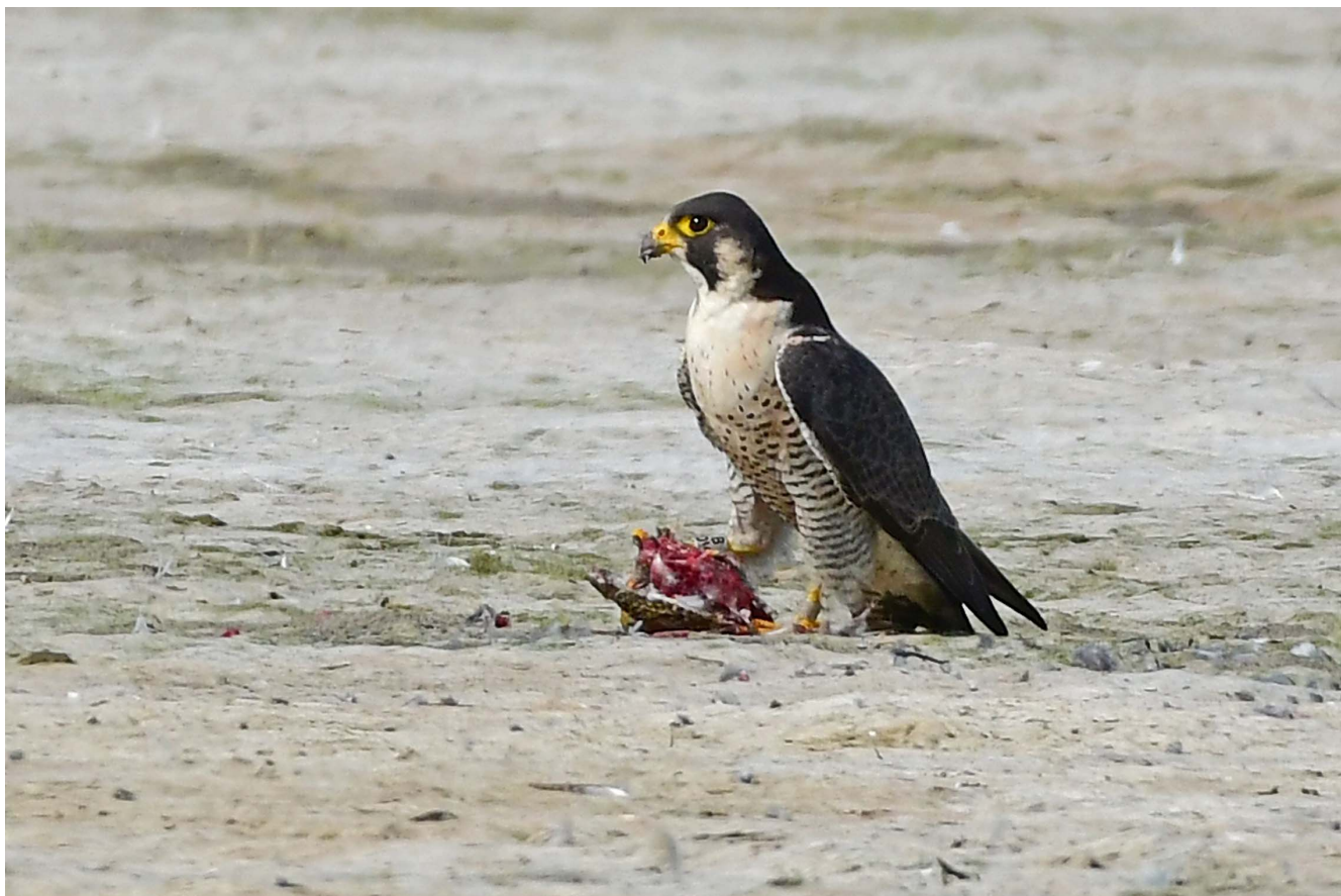
31 augustus 2018 Slechtvalk - Voorhout - Elsgeesterpolder

Er waren dit jaar vier grotere percelen die vogels aantrokken en met enige regelmaat door vogelaars bezocht werden. In de Elsgeesterpolder lag vanaf ongeveer 2 juli t/m 29 augustus een perceel onder water. Dit was volgens de ‘traditionele’ methode, zonder plastic schotten. Het bleek een perceel waar altijd wel iets te beleven viel: rustende meeuwen en veel variatie aan steltlopers, met bijvoorbeeld 3 Krombekstrandlopers op 17 juli (AM RF). Het aantal eenden was meestal laag. Van 3 tot 13 augustus verbleven er wel tot 5 Zomertalingen (JW ea), mogelijk broedvogels uit de buurt. Vanaf 23 juli tot 9 september kwam er regelmatig een Slechtvalk jagen. Tussen de meeuwen zaten tot half augustus regelmatig