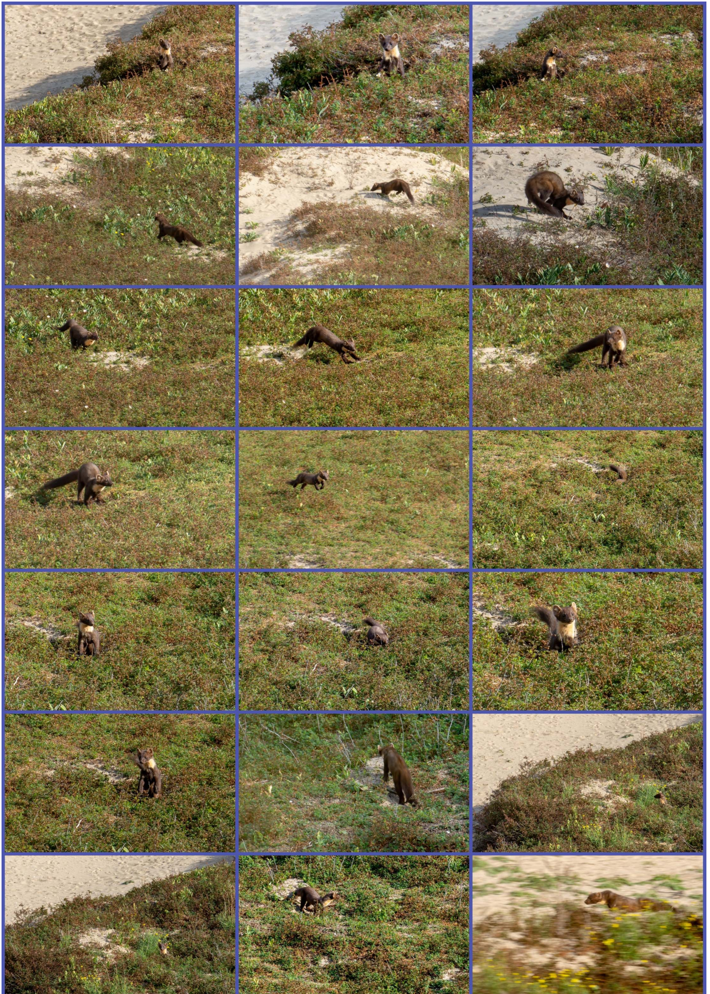
30 september: Een Boommarter, midden in het open duin van de Coepelduynen, aan het jagen.