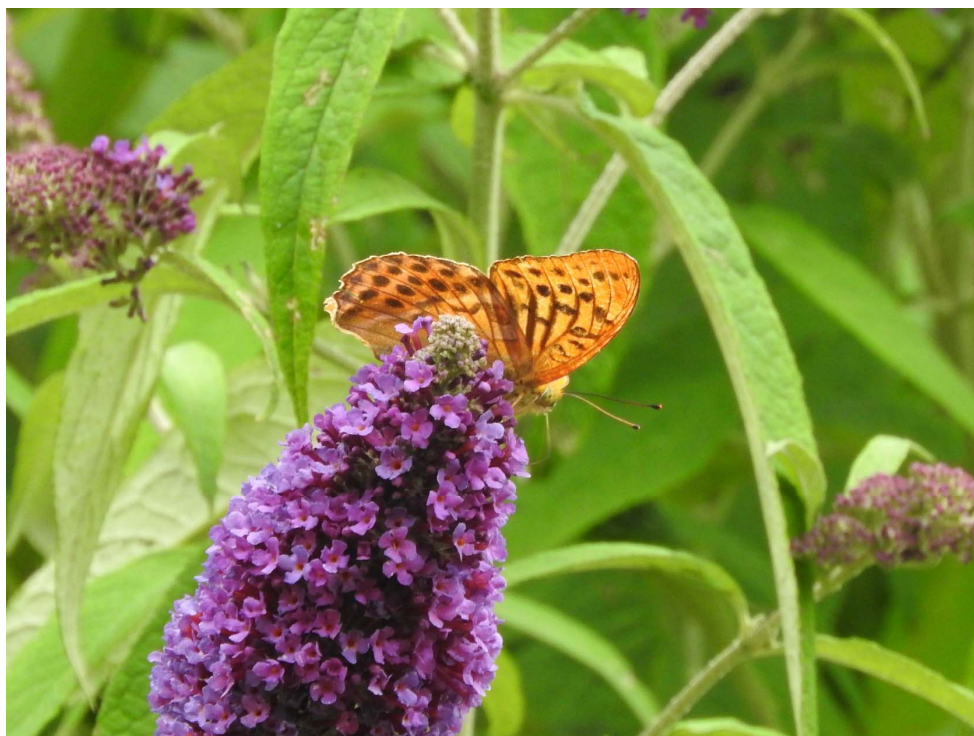
7 juli 2018 Keizersmantel - Noordwijk aan Zee - Duinpark

Het Koelvinkje is verder doorgedrongen naar het zuiden van ons waarnemingsgebied, met 6 op 1 juli op Willem v.d Bergh (GB). Eikenpages waren op meerdere plekken langs de binnenduinrand en de landgoederen aanwezig, o.a. op 1 juli op Willem v.d. Bergh (GB). Het Zwartspruetdikkopje is juist erg schaars geworden met maar 2 waarnemingen dit kwartaal langs de Achterweg op 4 juli (BB) en bij het Wantveld Katwijk op 9 juli (TH). Op 7 juli zat er een Keizersmantel in het Duinpark (JD).