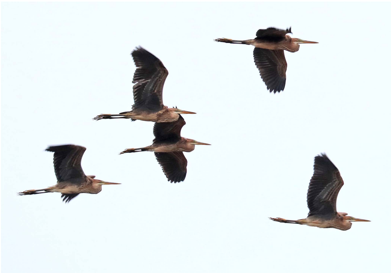
12 augustus 2018 Purperreiger - Katwijk aan Zee - De Puinhoop

In de eerste week zette het warme en droge weer van juli door en was er landelijk opnieuw sprake van een hittegolf. Vanaf 8 augustus kwam het weer onder invloed van depressies boven de Noordzee en viel er voor het eerst sinds anderhalve maand weer af en toe regen. Door het warme zeewater zaten daar zware buien tussen. Desondanks bleven de temperaturen het grootste deel van de maand hoog.