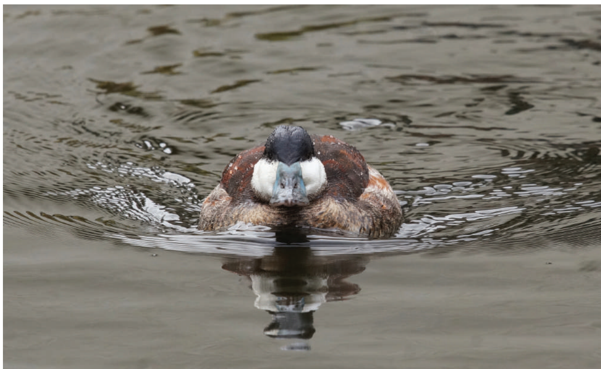
Winterkleed mannetje rosse stekelstaart