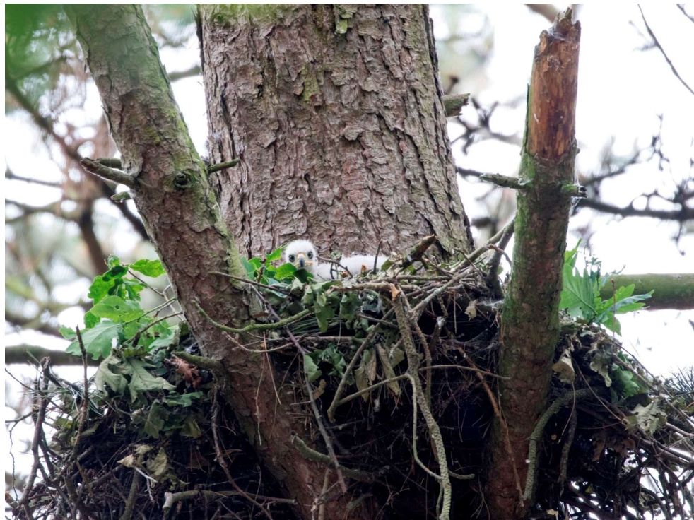
Jonge Havik op het nest - foto: George Hageman

Schrama is een afwisselend en interessant gebied en kent vooral bos, veel loofhout zoals Eik en hoge populieren, naast naaldbos. De perceelgrenzen omsluiten een groot deel van het Vogelenveld, een vergraste vlakte waarop veel Damherten grazen. Vanwege het zeer afwisselende oude bos en de vele randen is het een vogelrijk gebied met verrassende waarnemingen.