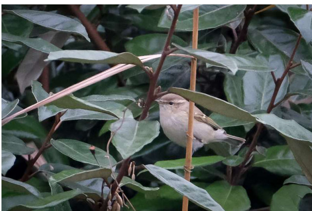
Humes Bladkoning – 28-12-2018 Katwijk aan Zee – Rijnsoever

De maand december was de eerste sinds de zomer dat er weer veel regen viel. Dat kwam door een zuidwestelijke stroming die ook zorgde voor relatief hoge temperaturen. Tussen de 11° en de 16° en na de 24° werd het met een oostelijke stroming wat kouder, maar van winter was de hele maand nog geen sprake. Rond de 10° trok de noordwestenwind aan tot windkracht 6 en ook later in de maand waren er dagen met hardere wind tot windkracht 5.