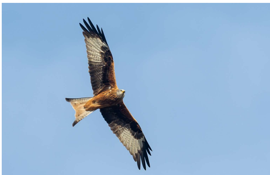
Rode Wouw - 31-10- 2018 Noordwijk - Noordzijdepolder - Duinweg

Een Rode Wouw zien is altijd een hoogtepunt. In de herfst trekken ze mondjesmaat door Nederland, met de piek in oktober. In het zuidoosten van het land zien trektellers er dan soms meerdere op een dag. Ze zitten daar nog net in de trekbaan die de wouwen van Scandinavië naar hun overwinteringsgebied in Zuid-Frankrijk en Spanje voert. De Rode Wouw heeft het op veel plaatsen in zijn verspreidingsgebied moeilijk, maar zit in Scandinavië in de lift. Passeerden er begin jaren tachtig zo'n 100 Rode Wouwen per jaar Falsterbø, tegenwoordig is dat opgelopen naar ruim 4000. In ons waarnemingsgebied merken we dat met een lichte groei in het aantal wouwen dat we elk jaar zien. Ook