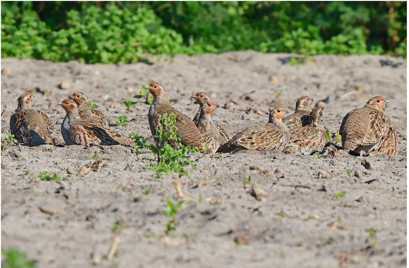
Patrijs – 10-10-2018 Voorhout - Elsgeestepolder