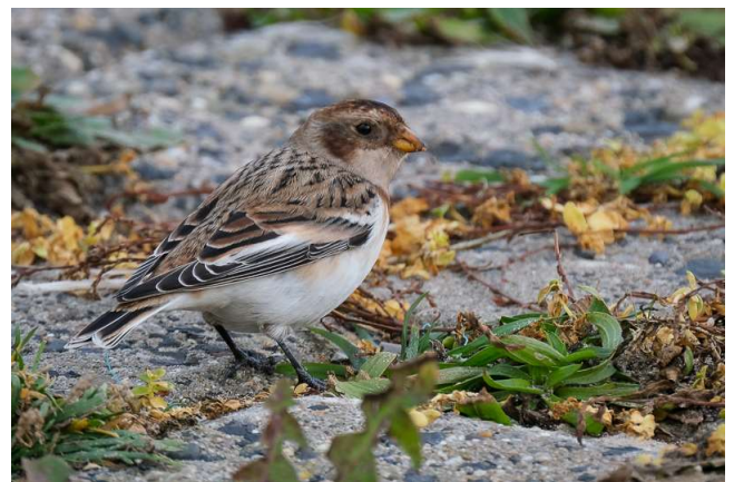
Sneeuwgors – 19-11-2018 Katwijk aan Zee - Buitenwatering

Met het zachte weer bleven dagvlinders lang actief. Op 14 november vloog er nog een Atalanta over de Puinloop (RR) en was er een Kleine Vuurvlinder aanwezig in de AWD (SB). Het hele kwartaal lagen er regelmatig, onder grote belangstelling, één of twee Gewone Zeehonden te rusten langs de Uitwatering van Katwijk (JZw ea).