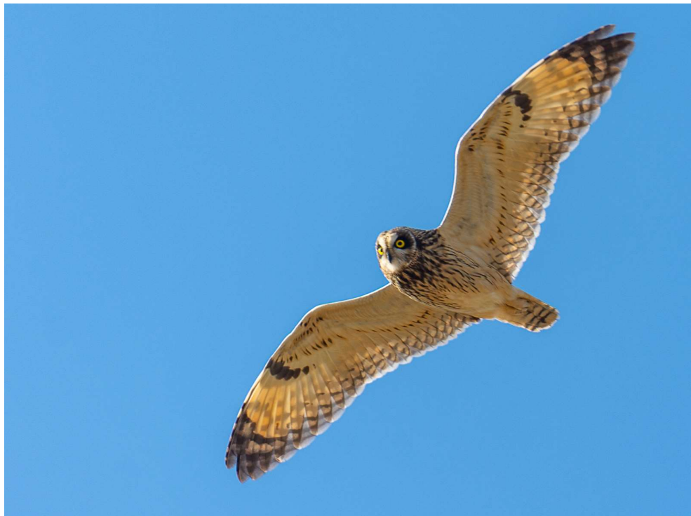
Velduil – 10-10-2018 Coepelduyn C1

kort daarna ook opgepikt bij Katwijk. Ook op 12 en 28 oktober vloog er één over de Puinhoop (RR). Op 14 oktober was er één aanwezig op 's Gravendijck (CZ). Op 28 oktober vloog een Pestvogel over de Noordduinen (MW). Bladkoningen zitten nog steeds in de lift. Ze werden de hele maand gevonden, tussen 5 en 17 oktober zelfs dagelijks. Op 6 en 7 oktober zaten er op verschillende plekken in ons waarnemingsgebied minimaal 9 resp. 11 (CZ JS JF ea). Met het warme weer waren er late waarnemingen van Paapjes , op 6, 7 en 10 oktober in de Coepelduynen (AM ea) en 17 oktober bij de Noordwijkse Golfclub (CZ). Ook laat was een Tuinfluiter op 10 oktober bij de Puinhoop (RR GT). Van 15 t/m 17 oktober scharrelde er