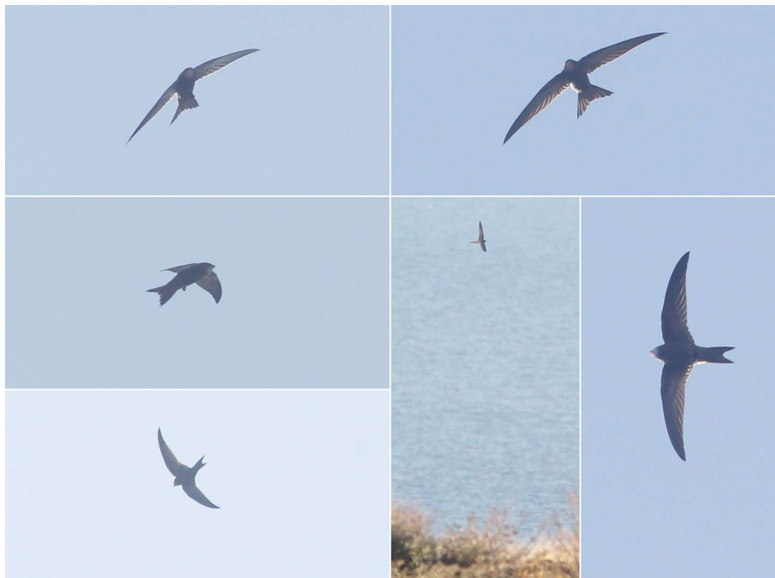
Vale Gierzwaluw – 15-11-2018 Katwijk aan Zee - De Puinhoop

Gierzwaluwen allang vertrokken. De hoofdmoot gaat al eind juli en in september trekt er nog een enkeling door. Landelijk gezien zijn er af en toe waarnemingen tot in november, maar bij een late gierzwaluw gaan altijd meteen de alarmbellen af: is het een Vale? Het lastige is om zekerheid te krijgen. Hij lijkt erg op de Gierzwaluw, dus foto's zijn een must. Dat is makkelijker gezegd dan gedaan: zie maar eens een gierzwaluw die