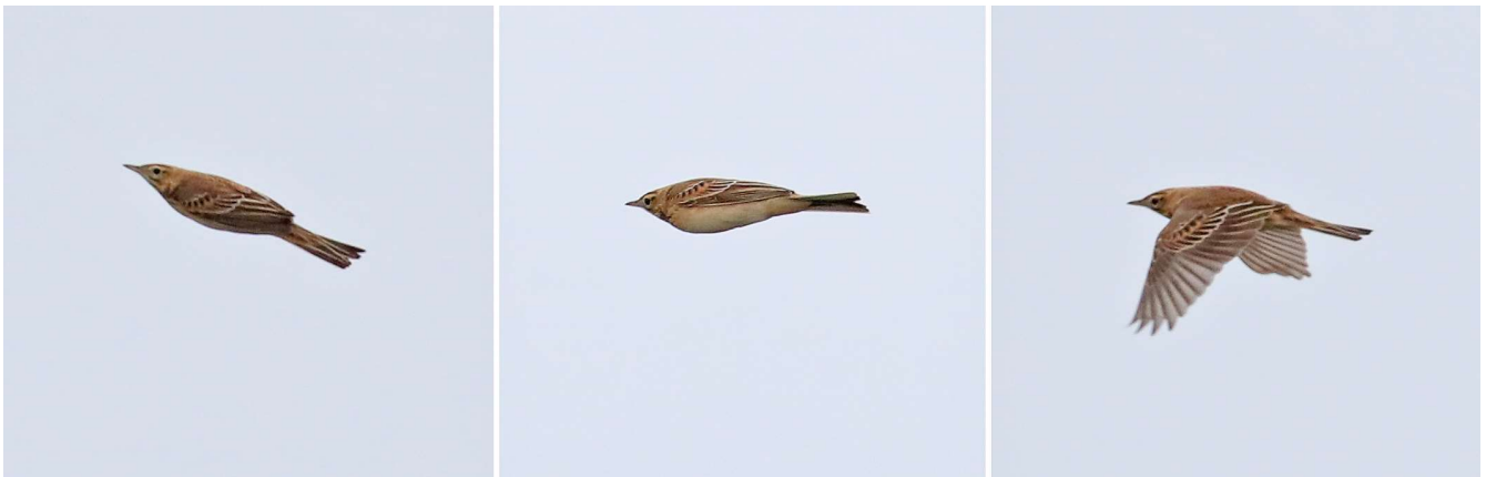
Grote Pieper – 11-10-2018 Katwijk aan Zee - De Puinhoop