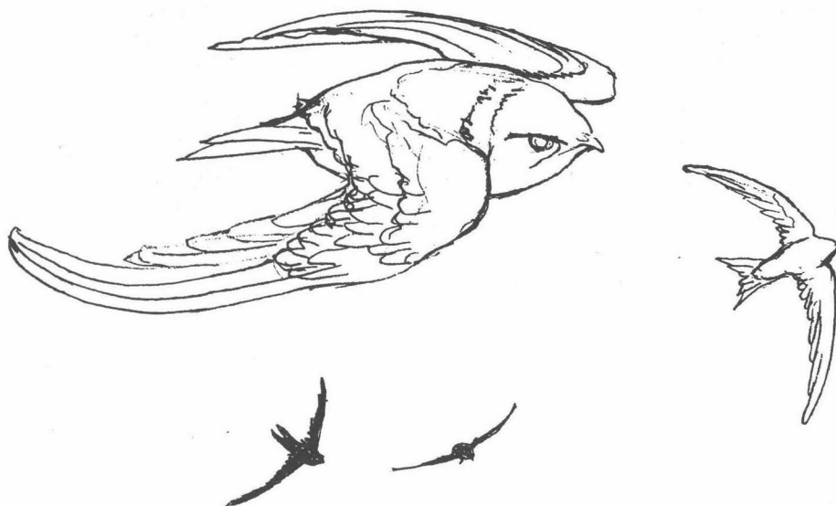
tekening Peter Huigen

Thea Dammen Dan. Stalpertstraat 4 hs 1072 XE Amsterdam; telefoon 6731635 en verder in alle buurten contactpersonen!