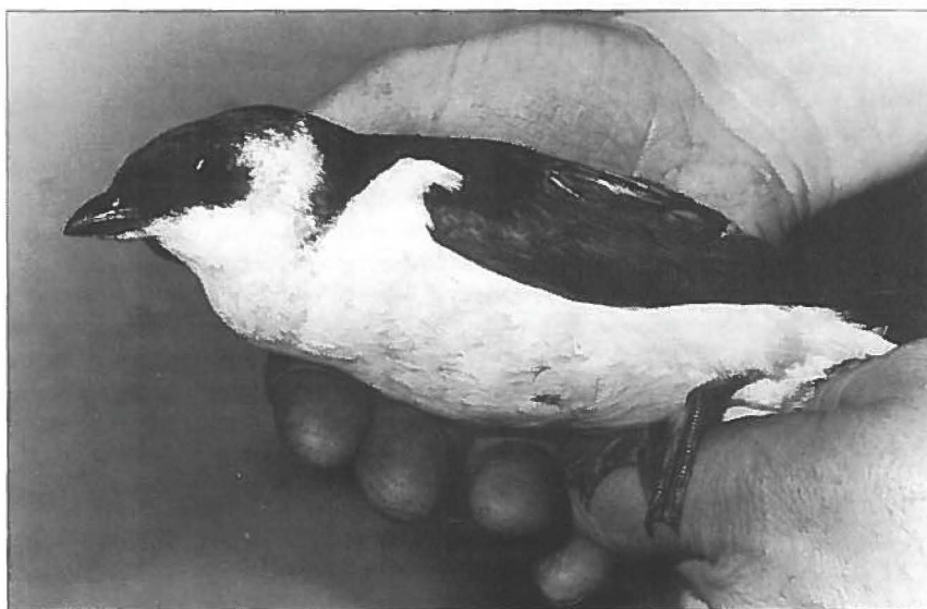
Kleine Alk , 19 november 1995 levend gevonden Wertheimpark, Amsterdam-centrum; gestorven 22 november 1995 en gefotografeerd in Artis, 23 november 1995. Het zevende geval voor Amsterdam.