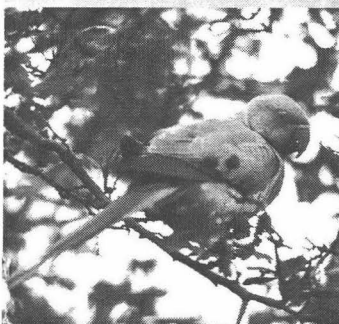
Halsbandparkiet / Vondelpark

Dwergmeeuw 28-12-98 IJmeer, De Krijgsman 2 exx. ad. (WWa).