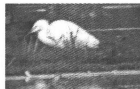
Kleine Zilverreiger, 14-08-2001 IJdoorn