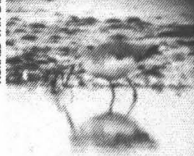
RONALD VAN DIJK

Poelruiter In de Kinsel en de Polder IJdoorn verbleven vanaf ca. half juli tot in augustus 2 ex., 1 ad. en 1 onv. (velen). Op 21-8-01 werd een ex. gemeld van de Kinsel (FvG).