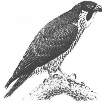
Slechtvalk Falco peregrinus

Slechtvalk Spaarnwoude : adult wijfje was vanaf medio september tot in april steeds in Inlaagpolder en omg., een enkele keer omg. Spaarnwouderplas (EdB, RvD, PJM, PT, EW). Adult mannetje (nog niet zo mooi uitgekleurd) was vanaf 8-1 regelmatig in haar gezelschap. Dit mannetje had rode kleurring - zuidelijk Scandinavië 2000 - om rechter tarsus en geen ring om linker. Dat maakt het aannemelijk, dat het gaat om hetzelfde mannetje dat voorjaar 2001 het vaste wijfje hier gezelschap hield. Dat wijfje was toen in juveniel kleeid (PJM, EW). Het adulte wijfje in de Inlaagpolder liet op 7-2 aan beide vleugels een onvolgroeide buitenste handpen (P10) zien. De lengte duidt erop dat ze P10 ergens medio december moet hebben geruid. Dat wijst op hoogarctische herkomst, omg. poolcirkel (P. van Geneijgen in lit.).