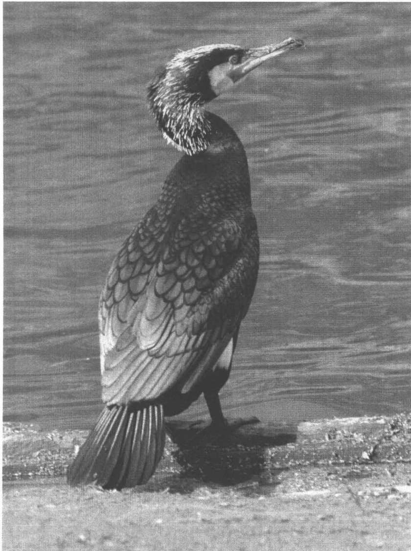
Een adulte Aalscholver in prachtkleed; maart 1997