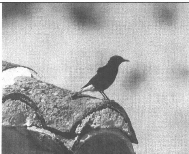
Zwarte Tapuit, Los Molinos, 25 april 2003

In de groeve wordt elke dag met groot materieel gewerkt, maar in het gedeelte dat niet geëxploiteerd wordt, is een grote kolonie rotsvogels gevestigd. Er broeden flinke aantallen Alpengierzwaluwen, Rotsduiven, Kauwen en Huiszwaluwen. Tussen de zwaluwen nestelen enkele paartjes Rotszwaluw. Verspreid over de helling zingen en baltsen Rotsmus, Cirlgors, Blauwe Rotslijster, Zwarte Roodstaart en Torenvalk. Op een rustige zondagmorgen, als er niet gewerkt wordt, klimmen we naar boven en laten de meeste soorten zich goed bekijken. Zwarte Tapuit en Dwergooruil laten zich hier ook zien en horen. Deze twee zijn overal rond het dorp gewone soorten. De Zwarte Tapuit is een echte karaktersoort van deze omgeving; op veel plaatsen is de spectaculaire baltsvlucht en de gevarieerde zang waar te nemen. De cam-