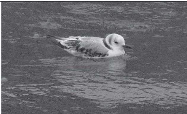
Drieteenmeeuw, Kostverlorenvaart, 25-11-2005