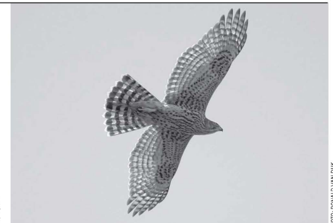
Juvenile Havik, Oeverlandenreservaat Amsterdamse Bos, 18-08-2005

Wateral 3-10 t/m 3-11 De Kluut >2 ex. (PM, PT, RR). 3-10 t/m 18-12 Houtrakkerbeemden max. >4 ex. (PM, PT). 3-10 t/m 29-11 Spaarnwouderveen 1 ex. (PT). 5-10 t/m 11-11 Ma Braunpad 1 ex. (PT). 9-10,