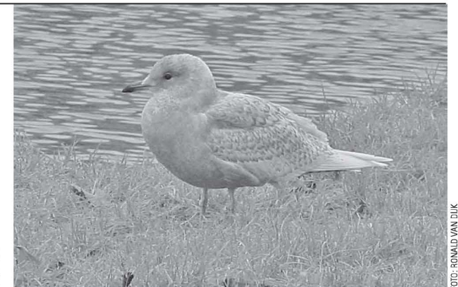
Kleine Burgemeester, Plesmanlaan, 23-12-2005