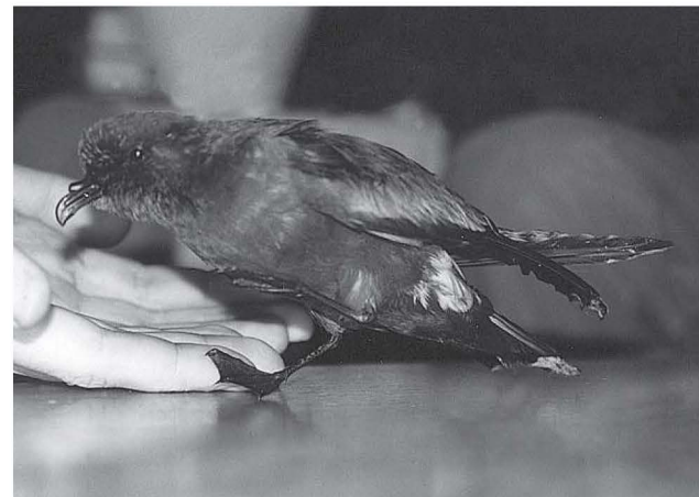
Vaal Stormvogeltje, Amstelveen, 26-11-2005

Middelste Zaagbek Vijfhoek najaarstrek: 2-10 1 ex., 10-10 6 ex. NO, 26-10 16 ex., 6-11 1 ex., 9-11 9 ex.,