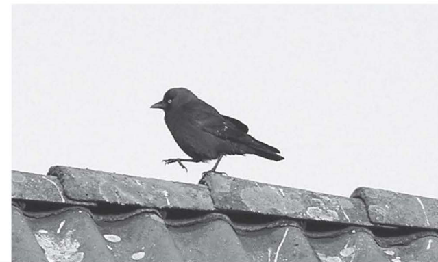
Kauw, Nigtevecht, 25-2-2006