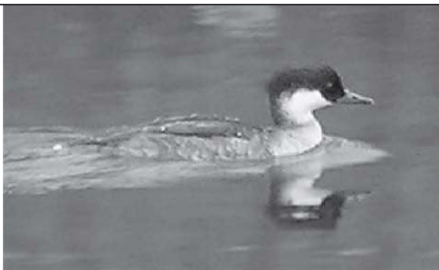
Nonnetje (v), in de Slotervaart, 31-1-2006